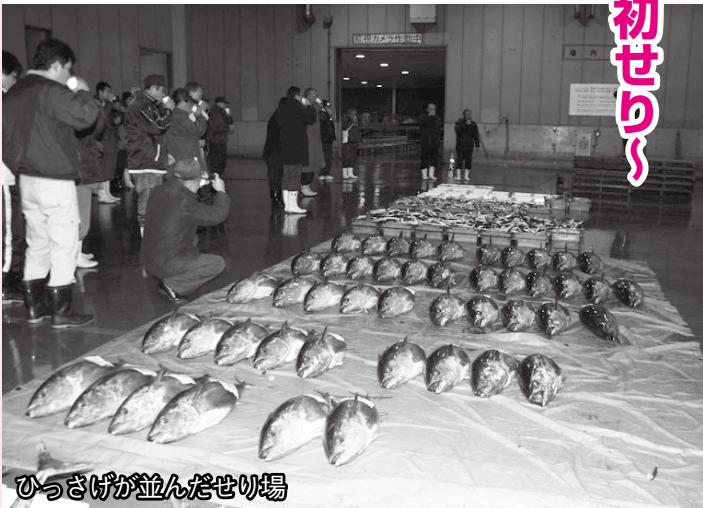
ひっさげが並んだせり場

せり開始前の式には、漁業関係者や仲買人など約100人が参加。威勢のよい掛け声とともにせりが始まり、トラフグをはじめ、アマダイ、クロマグロ、ひっさげ(本マグロとよこわの間)やヤリイカなど、萩沖で獲れた新鮮な魚が、次々とせり落とされ、市場全体が活気に包まれていました。