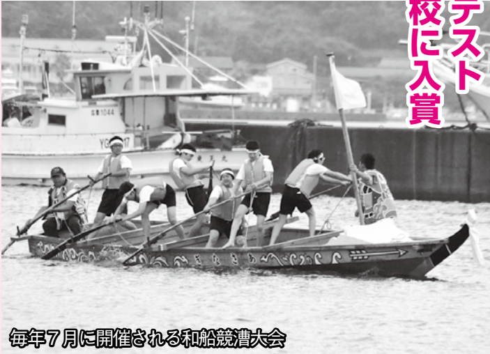
毎年7月に開催される和船競漕大会

越ヶ浜中学校では、毎日行う早朝ランニングと基礎を重視した体育の授業により体力向上に努めています。また、1971(昭和46)年から毎年7月に和船競漕大会を開催し、6月から地元漁師の指導のもと練習を重ねます。足腰を鍛える和船では、体力を培うだけでなくチームワークも育んでいます。