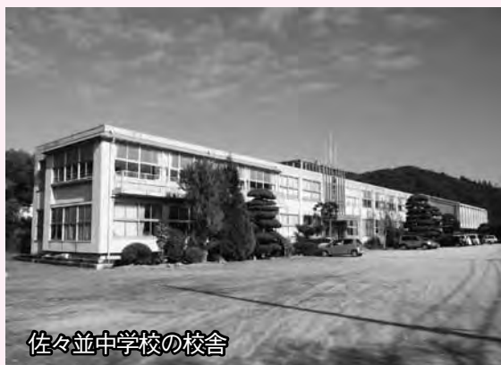
佐々並中学校の校舎

移動などを進め、3月に佐々並中学校の閉校式を行い、4月から明木中学校に子どもたちを迎える予定です。