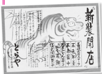
とらや新装開店の広告

で) ※会期中無休。 ■観覧料 大人500円、高・大学生300円、小・中学生100円