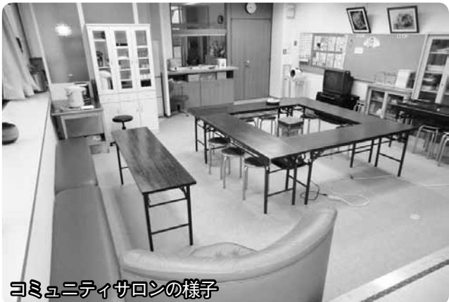
コミュニティサロンの様子