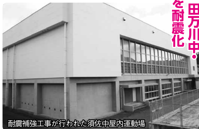
耐震補強工事が行われた須佐中屋内運動場