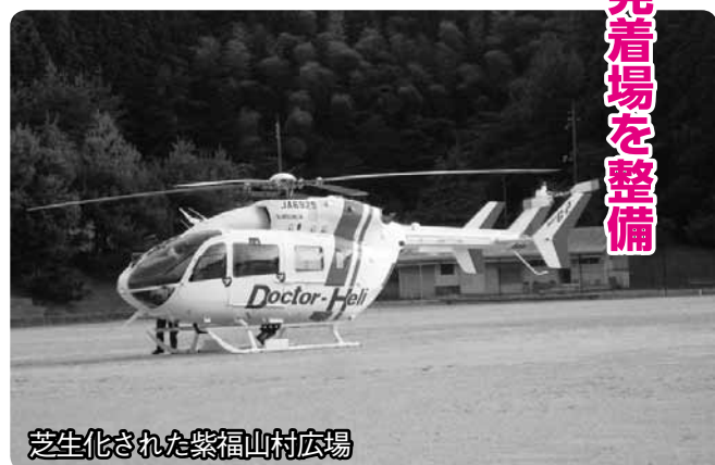
芝生化された紫福山村広場