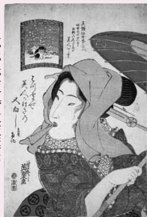
溪斎英泉「美艶仙女香はつ雪や美人のはきの又白し」(文政中期)