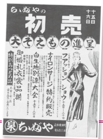
ちちぶや初売の広告