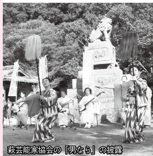
萩芸能家協会の「男なら」の披露

成24年の観光客数は、141万44人(前年比0.6%減)、宿泊者数は44万7253人(前年比2.9%減)でした。