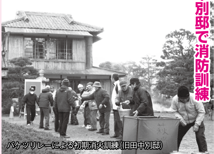
バケツリレーによる初期消火訓練(旧田中別邸)

市では、文化財防火デー(1月26日)に合わせて、毎年文化財施設で消防訓練を行っています。今年は重要伝統的建造物群保存地区の平安古地区にある旧田中別邸から出火したという想定で、放水による火災防ぎ訓練をはじめ、バケツリレーや消火器での初期消火訓練、避難誘導訓練、文化財の搬出訓練を行い、文化財愛護と防火・防災意識の高揚を図りました。