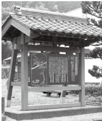
旭世代間交流施設の前