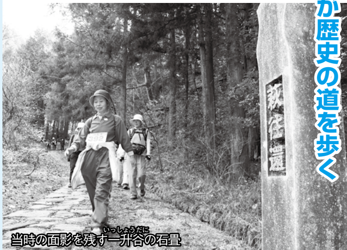
当時の面影を残す一升合の石畳

今年好天に恵まれ、当日は約200人のボランティアの協力もあり、参加者は春の日差しの中、江戸時代の面影が残る歴史街道のウォーキングを楽しみました。