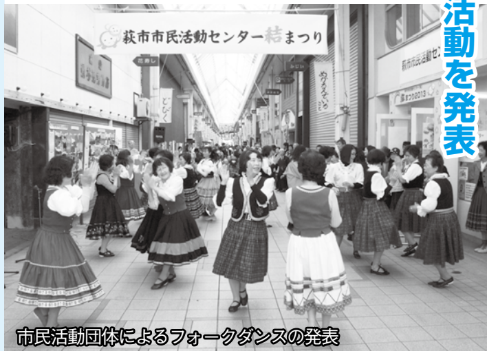
市民活動団体によるフォークダンスの発表

当日は、活動発表会やストリートダンス、よきこいのほか、フリーマーケットや各種団体による販売コーナー、展示コーナーなどがあり、会場は約1000人の来場者で賑わい、市民相互の交流が図られました。