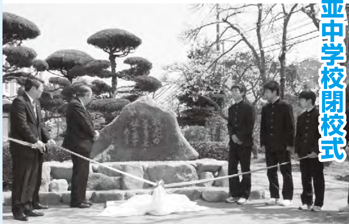
「我が心のふるさと佐々並中ありき」と刻まれた記念碑の除幕

これまでの卒業生や赴任した教員など、会場を埋め尽くす約200人が集まり別れを惜しみました。開校以来の卒業生の写真上映と式典の後には、記念碑の除幕が、桜の咲く校庭で行われました。今後、旧佐々並中学校の校舎と体育館に耐震補強工事を施したうえで、佐々並小学校を平成26年度に移転する計画です。