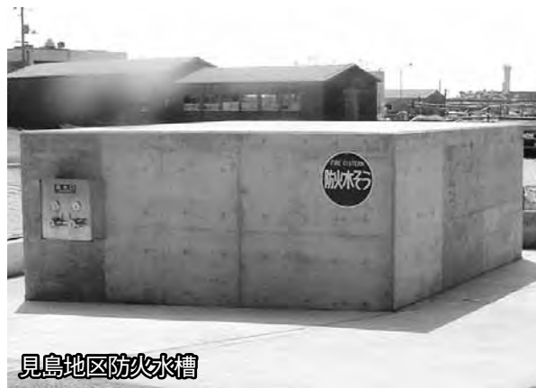
見島地区防火水槽