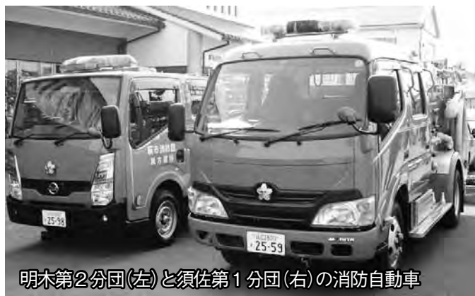
明木第2分団(左)と須佐第1分団(右)の消防自動車