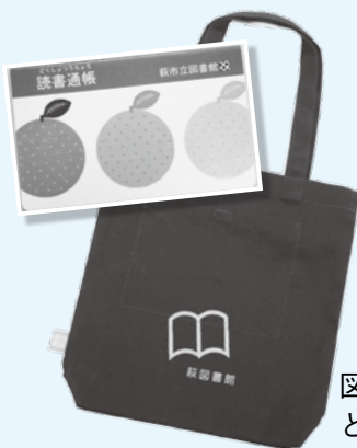
図書館バッグと読書通帳