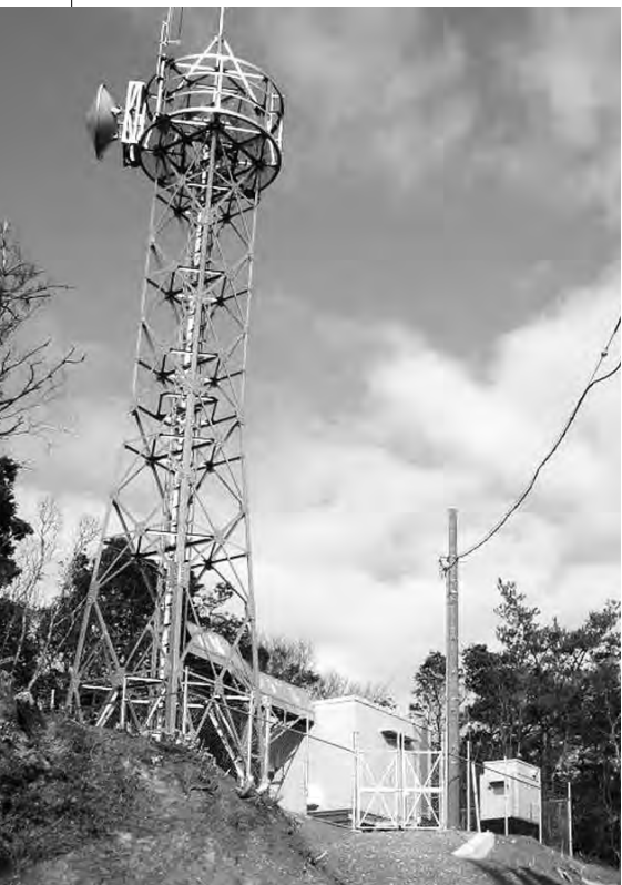
旭地域二つ峠(明木)

と整備費用の削減を目的に、山口市、長門市と共同で整備しました。25年度からデジタル化に併せて通信指令施設の更新を行い、災害時の円滑な消防・救急活動を行うため、無線の不感地域の解消を図ります。 【整備内容】基地局・中継局（4カ所）の铁塔、局舎、無線装置等の整備 【事業期間】平成23年～24年度 【総事業費】8億6994万円（うち国補助ほか2億4210万円）