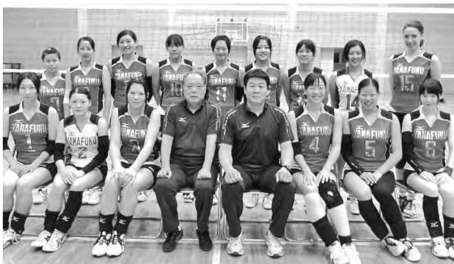
山口福祉文化大学女子バレーボール部

中国大学バレーボールリーグ戦秋季大会 (10月12～27日) で3位入賞、全国インカレに初出場。