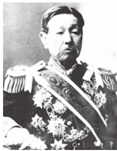
井上馨肖像 明治40年（1907）頃

長州ファイブの一人である井上馨は旧萩藩士で、初代外務大臣となった明治の元勳であるとともに、古美術収集家としても知られる。桂月の作品を伊藤博文に見せた時、馨も同席していた。馨は桂月が山口県出身だと知り、古絵画を研究するように勧めた。明治38年（1905）頃から、桂月は馨所蔵の古絵画を研究するため、馨の邸宅に通い詰めた。さらに馨の勧めによつて、馨の邸宅の近所に転居したほどだった。桂月は日本画家として大成した大恩人として、井上馨、瀧口吉良、絵画の師匠・野口幽谷の3人を挙げている。