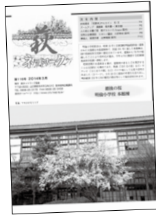
希望者に見本紙として3月号をお送りします