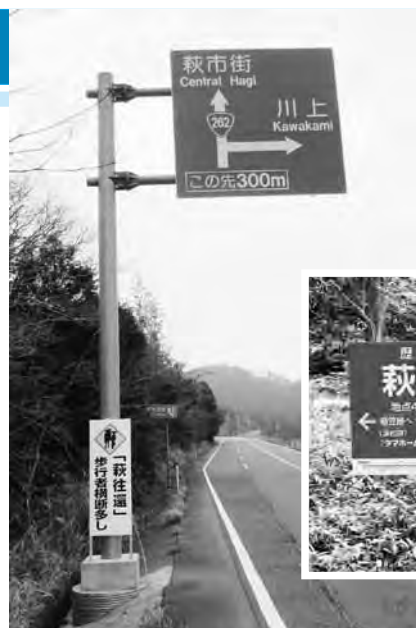
注意喚起の看板(左)とキロポスト標識