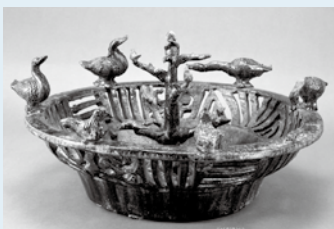
りよくゆうおうとう 緑釉鴨塘 後漢時代・1～3世紀 高さ 19.0cm

■観覧料 一般300円、学生(19歳以上)200円、70歳以上・18歳以下は無料 ■休館日 月曜日