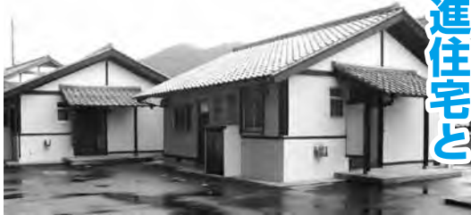
むつみ交流研修施設(左)と担い手促進住宅(右)