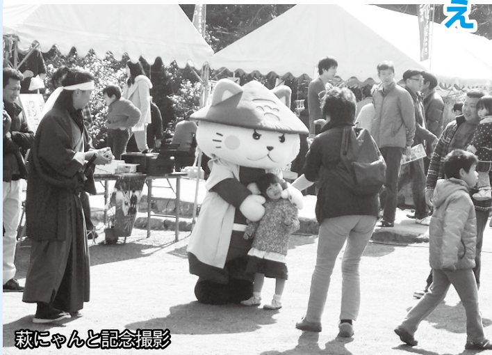
萩にゃんと記念撮影

会期前半の週末は好天にも恵まれ、多くの来場者が椿の花を楽しみました。また、萩にゃんと一緒に写真を撮る姿も多く見られました。