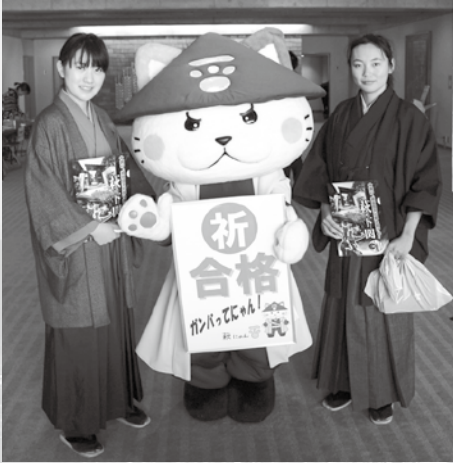
萩にゃんも受検者を激励