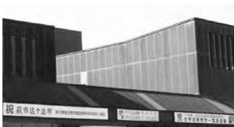
工事前(上) 工事後(下)