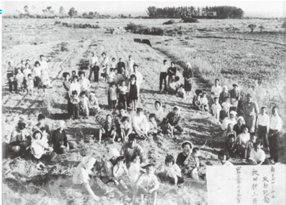
朝日ジャーナルに掲載 昭和37年(1962)、櫃島

展示を担当した職員が解説 ■とき 3月15日(土)、4月5日(土) 午後2時～3時 ■開館時間 午前9時～午後5時(入館は午後4時30分まで) ※会期中無休