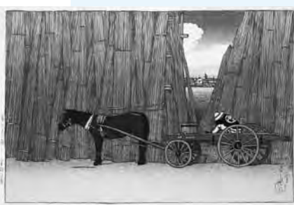
こまがたかし 「駒形河岸 東京十二題」 大正8年(1919)初夏 渡邊木版美術画舗所蔵

■年会費 一般2000円、19歳以上の学生1700円、70歳以上の方1400円 ◆ゴールデンウィーク期間中(5月3日～6日)のイベント ・3日～6日「美術館クイズ」(参加には観覧チケットが必要) クイズ終了後の抽選で各日3人に県立美術館「大浮世絵展」ペア招待券を進呈 ・3日午後1時30分～3時 記念講演「渡邊版画店と川瀬巴水」渡邊章一郎、聴講無料 ・4日 午前10時～、午後1時30分～「版画の摺り実演」、観賞無料 ・5日 午後2時～「なつかしい遊び」(けん玉、おはじき、メンコ等)、エントランスロビー、参加無料