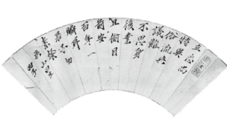
論じた松陰の扇面詩(複製、日本大学大学史編纂課蔵)

山田顕義は14歳の安政4年(1857)に松下村塾に入つたとされるが、正確な日付はわからない。当時、市之允と称した顕義を松陰と直接結び付ける証拠は、吉田松陰が贈つた扇面詩が残る程度だが、松陰は顕義に「志を立てよ」と武士のあるべき姿を言い聞かせた。この接し方は、国事を論じた高杉晋作や久坂玄瑞らへのそれとまるで異なる。 塾で松陰を補佐した富永有隣は、後年、国木田独歩に対し、つぎのように語っている。「正月の何日であつたか、市