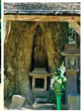
がんぎょうじ 願行寺のカヤ (指定No.49号)

道の駅「ハピネスふくえ」から、県道山口福栄須佐線をむつみ方面へ1kmほど進んで行くと願行寺に到着します。この願行寺門内には幹周が4m05cm、樹高約20mのカヤの木がそびえ立っています。願行寺は文禄元年(1592)に創建されたとされていることから、このカヤの木もこの当時に植栽されたものと推定されます。このカヤの木には木喰 もくじき 五行上人 ごぎょうしやうにん によって像高71.2cmの薬師如来像が彫られており、県内随一の立木仏として重宝されており、市の文化財に指定されています。また、「耳の薬師様」としても崇められ、遠方からお参りに来られる方も多くいらっしゃいます。