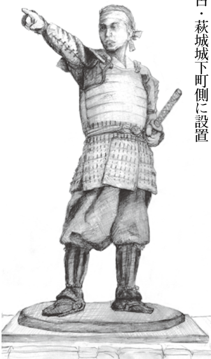
銅像のイメージ図