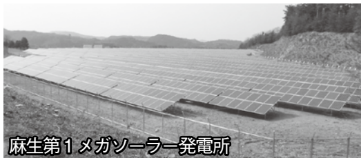
麻生第1メガソーラー発電所