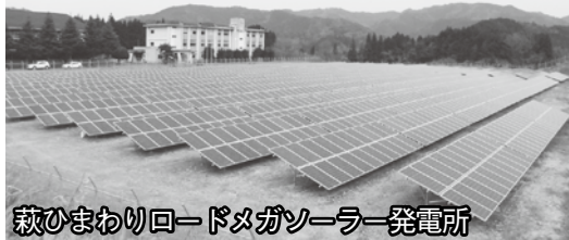
萩ひまわりロードメガソーラー発電所