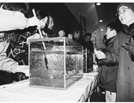
昨年のしろ魚おどり食い試食