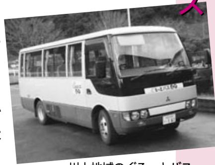
川上地域のぐるっとバス

川上・むつみ・旭・福栄地域で、総合事務所や診療所等の地域の拠点を結ぶ「ぐるっとバス」の運行を、昨年4月から開始しました。 4月から1月までの利用者は1万3597人で、1便あたり約3人の利用があり、市民の皆さんの足として定着してきました。4月以降も引き続き運行を継続していきます。