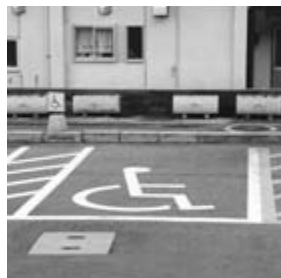
駐車はマナーを守ってください