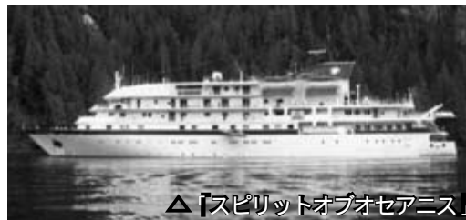
△「スピリットオブオセアニス」