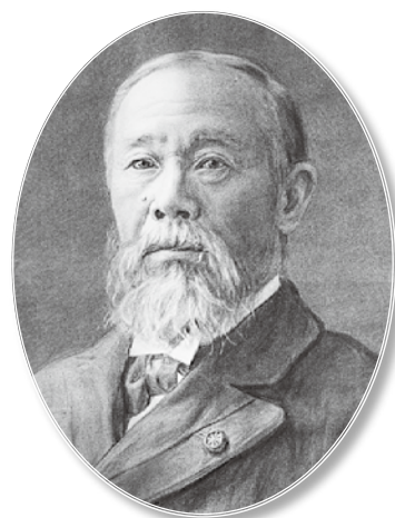
伊藤博文肖像画 明治42年（1909）伊藤が亡くなって1か月後に描かれた。

【内閣の父】天保12年〜明治42年（1841〜1909） 幕末期に尊王攘夷派の志士として奔走し、23歳で密航。明治時代には維新の元勳として活躍。初代内閣総理大臣となり、枢密院議長として明治憲法制定に尽力し、立憲国家確立に貢献しました。