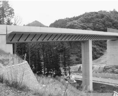
小郡萩道路(美東町・第一長登橋)