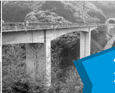
萩・三隅道路(飯井第一橋)