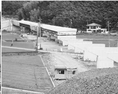
小郡萩道路(美東町・第一大田川橋~田津高架橋)