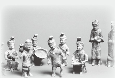
踊る農民・加彩・北魏時代