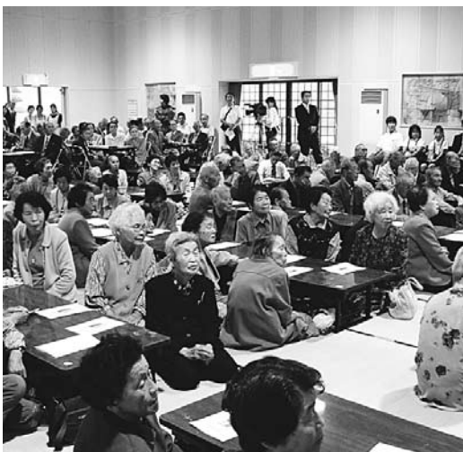
老人のつどい (福栄地域)