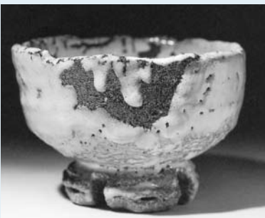
鬼萩窯変割高台茶碗 (2006年)