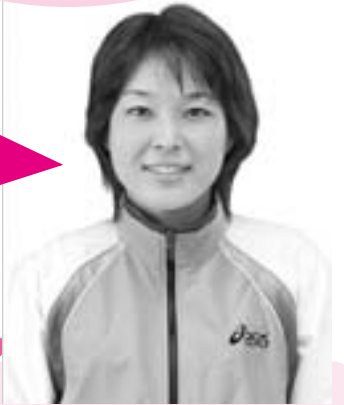
やまぐち えり 山口衛里選手

1999年東京国際女子マラソン優勝、2000年シドニーオリンピックで7位。自己記録は2時間22分12秒。