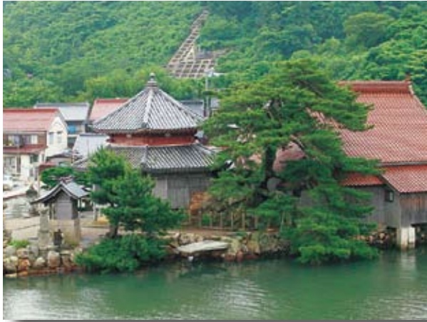
江崎西堂寺の岩割松