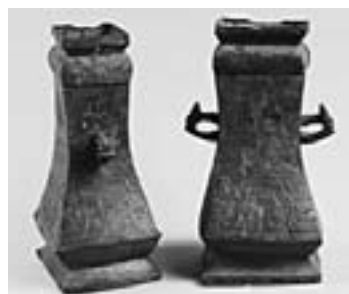
銅方壺 春秋時代 山東省出土(海陽市博物館蔵)

中国文明の東縁部にあり、遼東半島や朝鮮半島へ渡る海上ルートの要地として発達した、山東半島東部の煙台地区の西周時代から戦国時代までの考古学資料を一堂に展示。145点の文物を通して、朝鮮半島や日本列島との文化交流の歴史を紹介いたします。