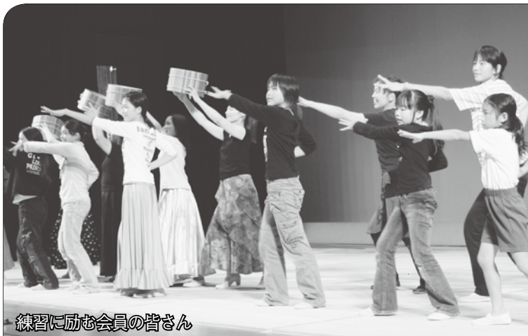
練習に励む会員の皆さん

■入場券販売所 市役所案内係、各総合事務所、アトラス萩店、サンリブ萩店、萩楽器店