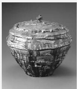
こせとゆうふたつぼ 古瀬戸釉蓋壺 (1967年)