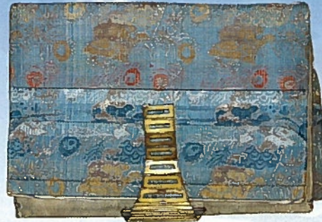
吉田稔磨紙入れ 池田屋事変で新撰組と戦い亡くなった松陰門下生・吉田稔磨形見の紙入れ。

アメリカ密航に失敗し獄につながれた松陰が、金銭を差し入れてほしいと友人に頼んだ書簡。