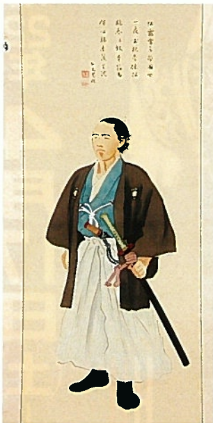
坂本龍馬肖像画 萩で玄瑞から草莽崛起論を聞かされた直後、土佐を脱藩した坂本龍馬の肖像画。