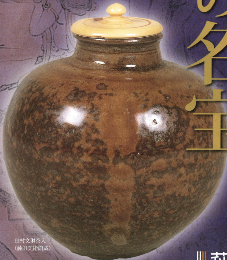
田村文琳茶入 (藤田美術館蔵)