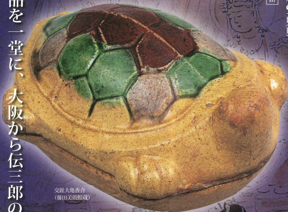
交趾大亀香合 (藤田美術館蔵)