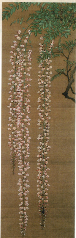
中蓮華左右藤花楓葉図 本阿弥光甫筆