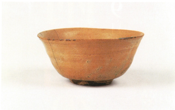
本手利休斗々屋茶碗 大名物

伝三郎が収集した藤田美術館所蔵の重要文化財を含む絵画や墨跡・茶道具など、日本を代表する逸品を一堂に展示します。