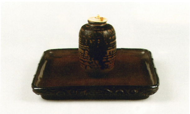
古瀬戸肩衝茶入 銘在中庵 中興名物 (国指定重要文化財)