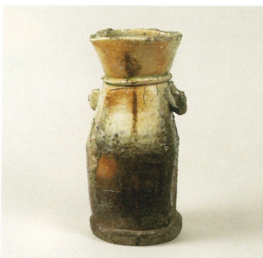
古伊賀花生 銘寿老人 (国指定重要文化財)