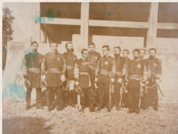
西南戦争での顕義と司令長官ら 顕義は左から4人目