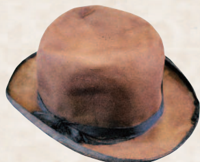
顕義の墓に埋葬されていた帽子 （日本大学大学史編纂課蔵）