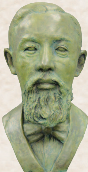
遺骨を元に制作された顕義の復顔像（日本大学大学史編纂課蔵）