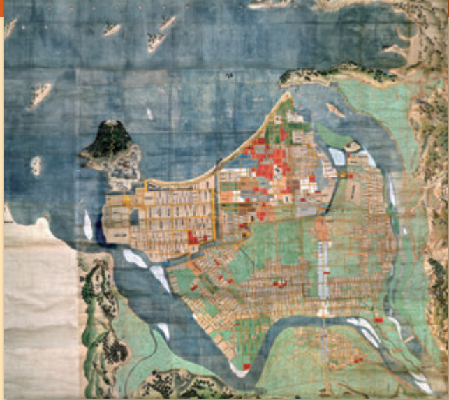
▲ 現存最大級、江戸中期の萩城下町絵図 「享保～延享年間 萩城下町絵図」(萩博物館蔵)

本展では、萩博物館が長年にわたり収集してきた膨大な資料 ぼうだい の中から、江戸時代に作成された地図を中心に紹介します。それら古地図に描かれたふる里や国の姿かたちは、どのようなものだったのでしょうか。 ちやうしゅうはぎ 長州萩から日本、国外へと視野を広げ、魅力たっぷりの古地図の世界にいざないます。