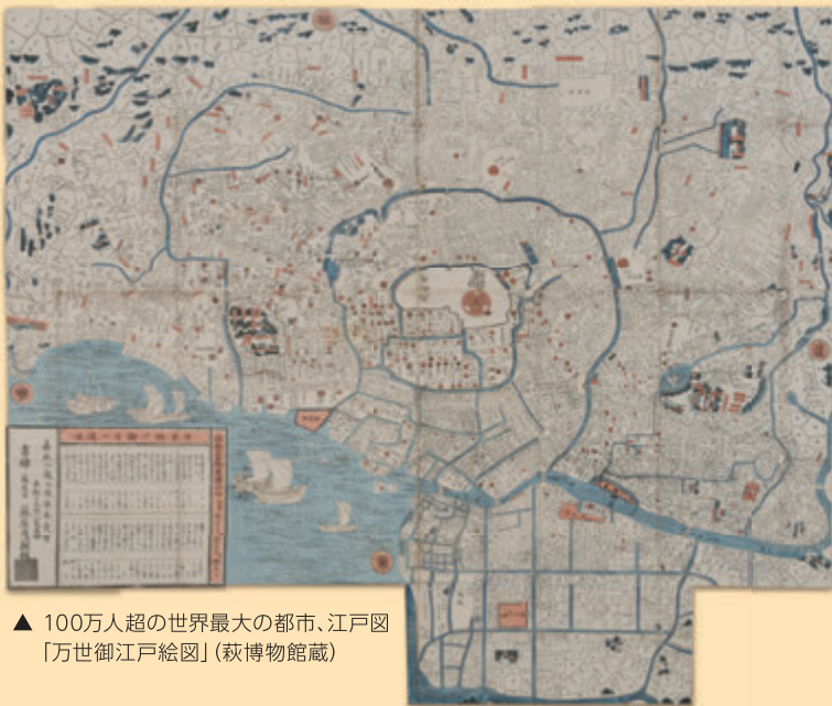
▲ 100万人超の世界最大の都市、江戸図 「万世御江戸絵図」(萩博物館蔵)