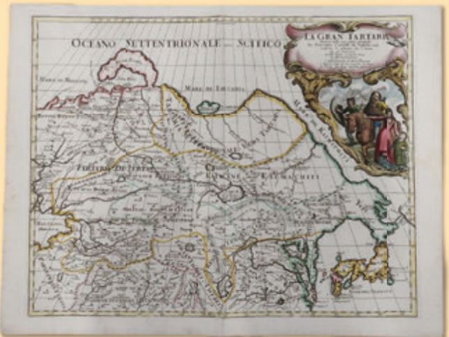
▲ ヨーロッパから見たアジア・日本の姿形 「LA GRAN TARTARIA (偉大なタタルリア)」(萩博物館蔵、おがわ是苦集)