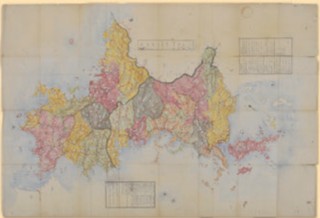
▲ 本支藩・宰判を色分けした長州藩領の絵図 「長門・周防両国図」(萩博物館蔵)