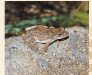
▲ 初夏の長門峡を美声で彩るカジカガエル(萩博物館蔵)