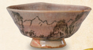
▲ 北海が長門峡を絵付けた「長門峡絵付萩焼杯」 (萩博物館蔵)