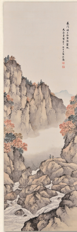
▲ 北海が長門峡保全のために描いた「長門峡上和留瀬霜楓」 (須佐歴史民俗資料館蔵)