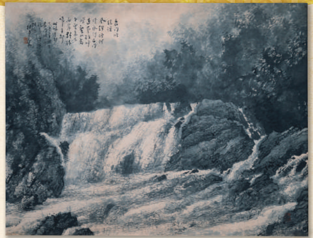
▲ 萩出身の画家・松林桂月が描いた「長門峡」 (山口県立山口博物館蔵)

令和5年(2023)は、長門峡の名勝指定から100年目となる記念の年です。本特別展で長門峡の歴史や自然、芸術に触れて、長門峡の魅力を感じてください。そして、長門峡の現地へと飛び出し、実際に散策してみたいはいかがでしょうか？