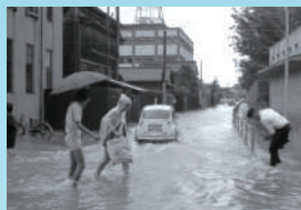
もしかしたら「まち」の姿が変わっていた?