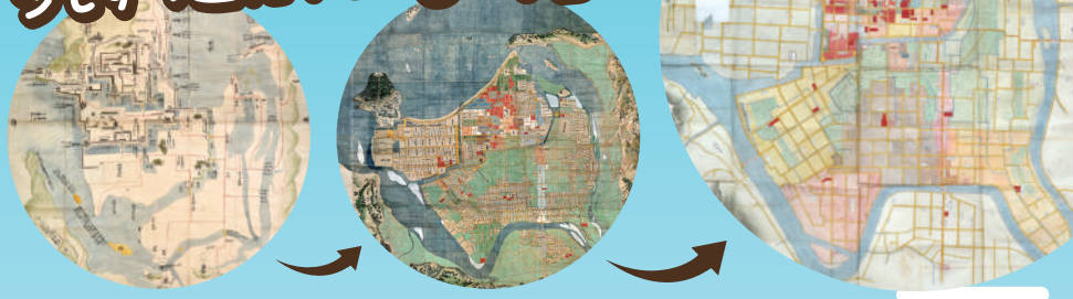
城下町草創期の絵図

萩は「まちじゅう」が屋根のない博物館です。「まちじゅう」にたくさんの歴史や文化、自然の「おたから」があります。今回の展示では、江戸時代から大きく変わらない萩の「まち」に息づいているひみつを、萩城下町を描いた絵図や古い写真などの資料でご紹介します。萩の「まちじゅう」に今も残っているたくさんの「おたから」を再発見してみよう!