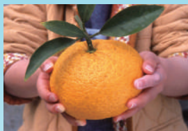
夏みかんが「まち」を救った!?