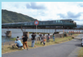
鉄道と「まち」の不思議な関係!