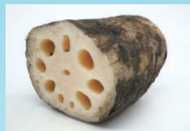
「まち」を支えた意外な存在!