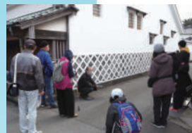
萩の「おたから」を守ったのはだれ?