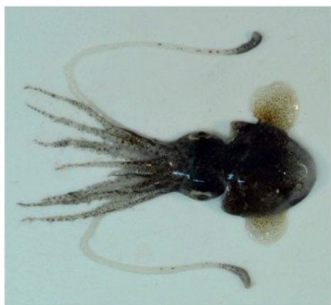
17 ミミイカ Euprymna morsei (Verrill, 1881)。22mmML, 仙崎湾, 2012 年 10 月 24 日, 天社博之採集, 萩博物館所蔵 (液浸:HH-Mo. 00557), 写真 (石丸太一撮影)。