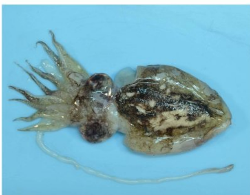
3 ハリイカ (コウイカモドキ) Sepia (Rhombosepion) madokai Adam, 1939. 45mmML, 下関市吉見沖 (水深30m), 2012年9月27日, 園山貴之採集, 萩博物館所蔵 (液浸:HH-Mo.00147)。