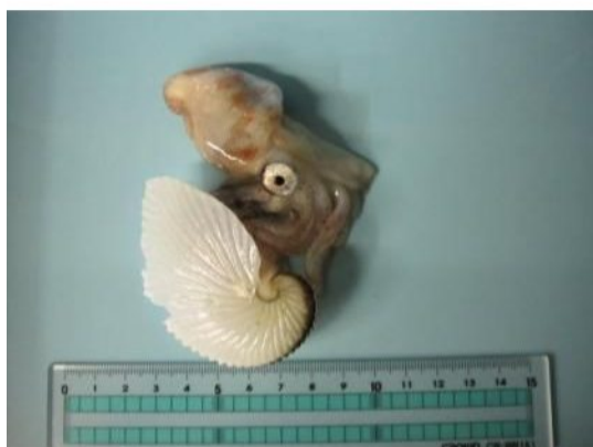
46 アオイガイ Argonauta argo Linnaeus, 1758。 37mmML, 長門市沖, 2010年9月4日, 写真のみ(河 野光久撮影)。