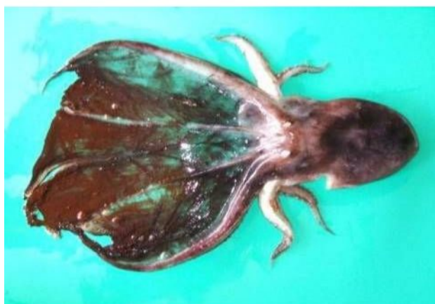
44 ムラサキダコ Tremoctopus violaceus gracialis (Eydoux & Souleyet, 1852)。170mmML, 長門市三 隅野波瀬漁港, 2006年9月15日, 写真のみ。