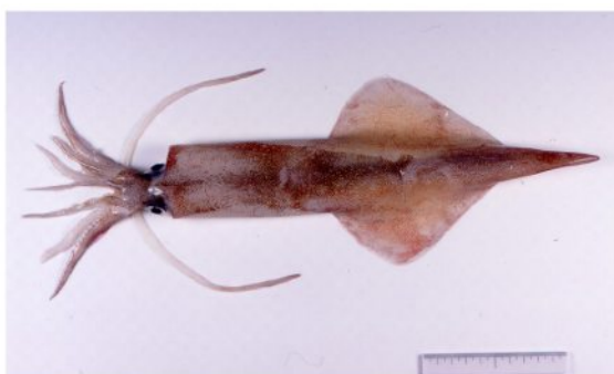
20 ヤリイカ Loligo (Heterololigo) bleekeri Keferstein, 1866. 308mmML, 長門市三隅野波瀬地先, 2007年3月14日, 写真のみ 。