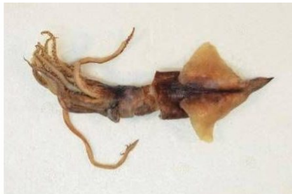
26 ホタルイカモドキ Enoploteuthis ( Paraenoploteuthis ) chunii Ishikawa, 1914。67mmML, 隠岐北沖*, 2012年7月25日, 島根県水産技術センター採集, 萩博物館所蔵 (液浸:HH-Mo.00551)。*山口県日本海域ではないが, 近隣海域のため参考写真として掲載した。