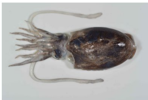
14 シリヤケイカ Sepiella japonica Sasaki, 1929。122mmML, 長門市通地先, 2012 年 10 月 26 日, 萩博物館所蔵 (液浸:HH-Mo. 00753), 写真 (石丸太一撮影)。