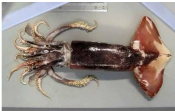
31 アカイカ Ommastrephes bartramii (Lesueur, 1821)。412mmML, 長門市三隅野波瀬地先, 2005年1月30日, 萩博物館所蔵(液浸:HH-Mo. 3589), 写真(堀成夫撮影)。