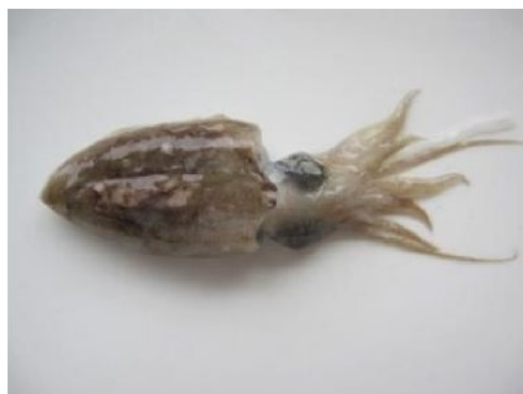
4 エゾハリイカ Sepia (Doratosepion) andreana Steenstrup, 1875. 55mmML, 長門市油谷津黄沖, 2012年5月23日, 写真のみ。