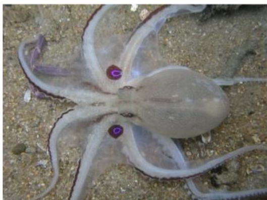
41 ヨツメダコ Octopus areolatus de Hann, 1840。下関市蓋井島地先, 2007年4月6日, 写真のみ。