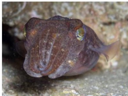
10 ボウズコウイカ Sepia (Doratosepion) erostrata Sasaki, 1929. 50~60mmML, 長門市青海島地先, 撮影日不明, 写真のみ。