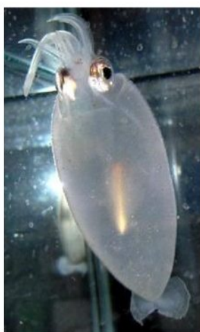
35 サメハダホウズキイカ Cranchia scabra Leach, 1817。75mmML, 阿武町筒尾地先, 2007年4月29日, 萩博物館所蔵(液浸:HH-Mo. 5080)。