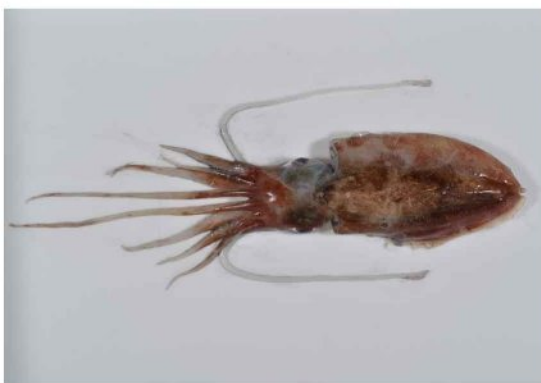
9 ウデボゾコウイカ Sepia (Doratosepion) tenuipes Sasaki, 1929. 85mmML, 萩市見島西沖, 2012年10月25日, 山本健也採集, 萩博物館所蔵 (液浸:HH-Mo.01920), 写真 (石丸太一撮影)。