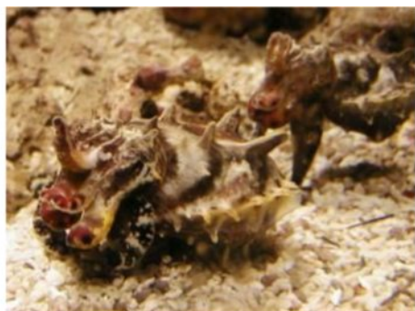
13 ハナイカ Metasepia tullbergi (Appellöf, 1886)。約 50mmML, 下関市豊浦町室津地先, 2003 年 5 月 20 日, 写真のみ。