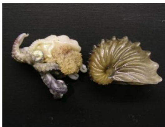
47 タコブネ Argonauta hians (Lightfoot, 1786), 1881。下関市豊浦町室津地先, 2006年10月12日, 写真のみ(土井啓行撮影)。