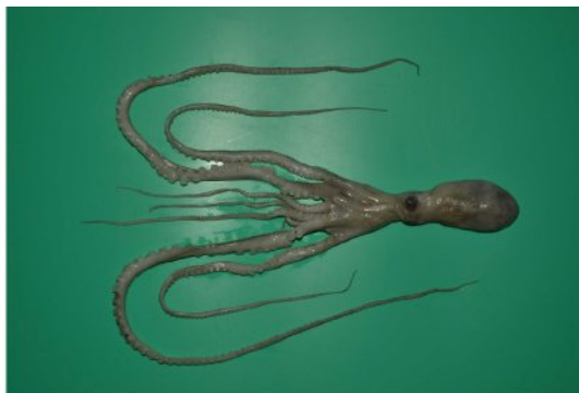
38 テナガダコ Octopus minor (Sasaki, 1920)。60mmML, 下関市彦島沖, 2012年11月2日, 土井啓行採集, 萩博物館所蔵(液浸:HH-Mo.05488)。