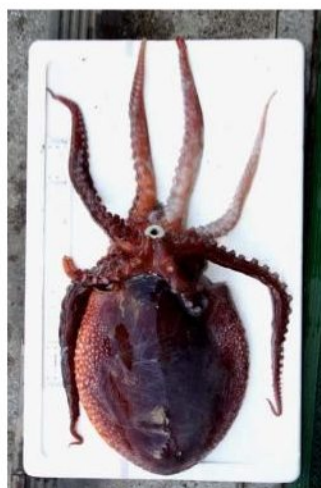
45 アミダコ Ocythoe tuberculata Rafinesque, 1814。250mmML, 萩市越ヶ浜嫁泣漁港, 2004年1月 29日, 内田正男・小池松利・楢本博昭採集, 萩博 物館所蔵(液浸:HH-Mo.5104), 写真(堀 成夫撮 影)。