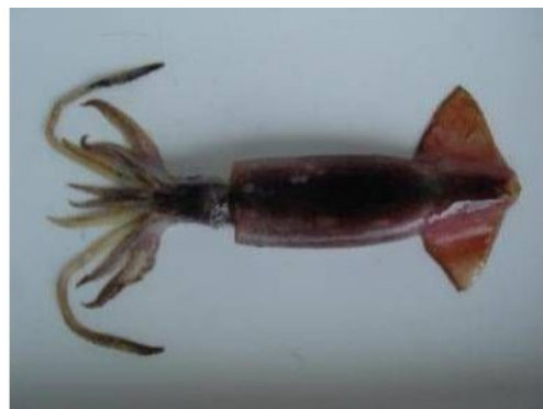
32 トビイカ Sthenoteuthis oualaniensis (Lesson, 1830)。121mmML, 長門市沖, 2008年7月30日, 写真のみ。