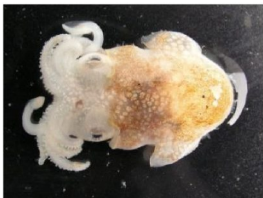
15 ミミイカダマシ Sepiadarium kochii Steenstrup, 1881。22mmML, 下関市豊浦町室津地先, 2007 年 4 月 17 日, 写真のみ。