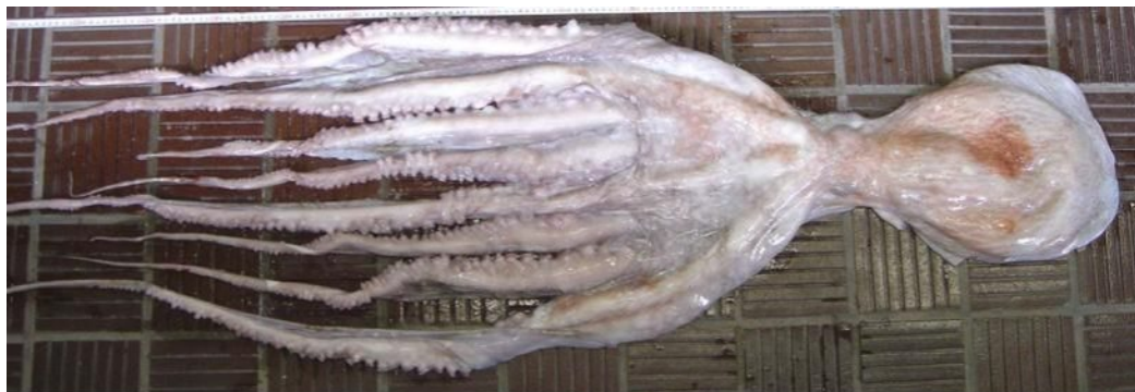
43 ミズダコ Octopus (Enteroctopus) dofleini (Wüker, 1910)。325mmML, 萩市見島沖, 2010年1 月27日, 写真のみ。