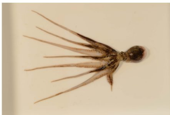
40 イイダコ Octopus ocellatus Gray, 1849。35mmML, 仙崎湾, 2012年10月16日, 天社博之採集, 萩博物館所蔵(液浸:HH-Mo.00559), 写真(石丸太一撮影)。