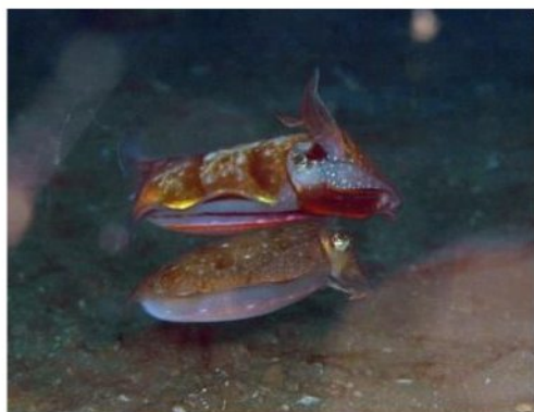
11 スジコウイカ Sepia (Doratosepion) tokioensis Ortmann, 1888. 約100mmML, 長門市青海島地先, 2008年1月13日, 写真のみ。