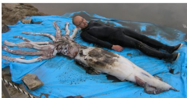
29 ダイオウイカ Architeuthis martensii (Hilgendorf, 1880)。約1.2mML, 長門市油谷川尻, 2007年2月6日, 岡本和徳採集, 萩博物館所蔵 (液浸:HH-Mo.5108)。