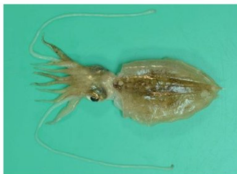
5 ヒメコウイカ Sepia (Doratosepion) kubiensis Hoyle, 1885. 61mmML, 山口県西沖 (対馬東沖), 2012年9月24日, やまぐち丸採集, 萩博物館所蔵 (液浸:HH-Mo.00484), 写真 (河野光久撮影)。