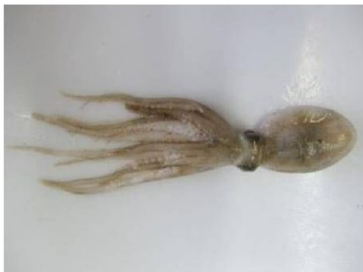
39 スナダコ Octopus kagoshimensis Ortmann, 1888。30mmML, 長門市油谷津黄沖, 2012年7月9日, 写真のみ。