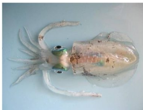
24 アオリイカ (シロイカ) Sepioteuthis lessoniana Férussac in Lesson, 1832. 69mmML, 長門市仙崎地先, 2012年10月9日, 山本健也採集, 萩博物館所蔵 (液浸:HH-Mo.00554)。