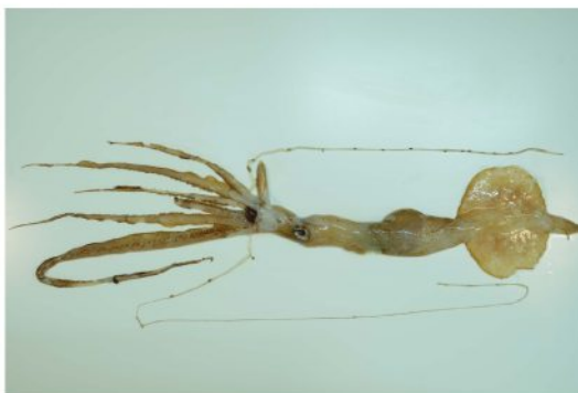
34 ユウレイイカ Chiroteuthis (Chirothauma) picteti Joubin, 1894。199mmML, 見島北西沖, 2012年10月12日, 落合晋作採集, 萩博物館所蔵(液浸:HH-Mo. 00751), 写真(石丸太一撮影)。