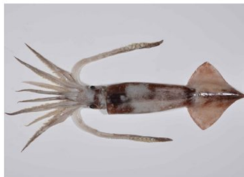
30 スルメイカ Todarodes pacificus Steenstrup, 1880。225mmML, 長門市通地先, 2012年10月26日, 河野光久採集, 萩博物館所蔵 (液浸:HH-Mo.00752), 写真 (石丸太一撮影)。