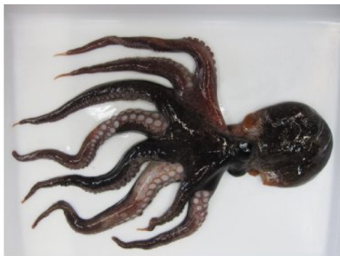
37 マダコ Octopus vulgaris Cuvier, 1797。80mmML, 下関市豊浦町小串漁港, 2012年10月17日, 松尾圭司採集, 萩博物館所蔵(液浸:HH-Mo.00560), 写真(河野光久撮影)。