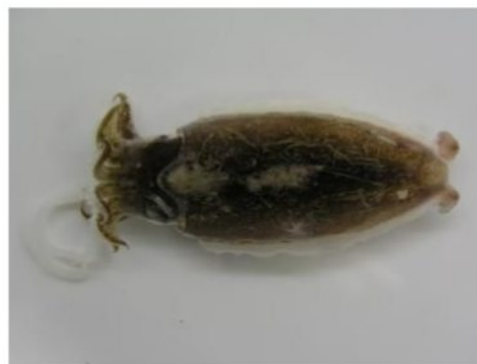
12 ミサキコウイカ Sepia (Doratosepion) misakiensis Wülker, 1910. 下関市豊浦町室津地先, 2007年4月11日, 写真のみ。