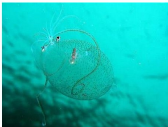
36 ゴマフホウズキイカ Helicocranchia pfefferi Massy, 1907。長門市青海島地先, 2009年4月20日, 写真のみ。