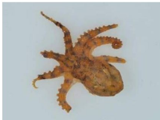
42 ヒョウモンダコ Hapalochlaena fasciata (Hoyle, 1886)。22mmML, 仙崎湾, 2011年7月29日, 森下敏夫採集, 萩博物館所蔵(液浸:HH-Mo.5102), 写真(内田喜隆撮影)。