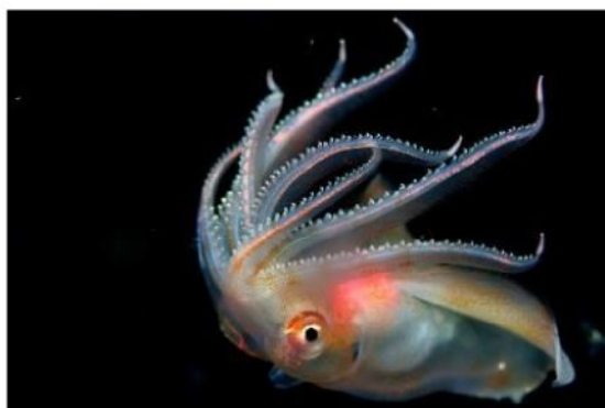
28 ヤツデイカ Octopoteuthis sicula Rüppell, 1844。長門市青海島地先, 2010年5月20日, 写真のみ。