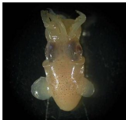
16 ダンゴイカ Sepiolo birostrata Sasaki, 1914。8mmML, 長門市油谷川尻沖, 1988 年 5 月 17 日, 河野光久採集, 萩博物館所蔵 (液浸:HH-Mo. 00492), 写真 (河野光久撮影)。