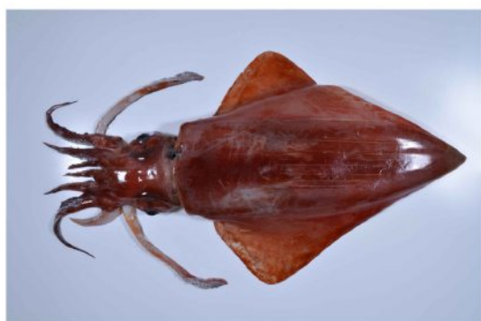
33 ソデイカ Thysanoteuthis rhombus Troschel, 1857。429mmML, 長門市通地先, 2012年10月26日, 河野光久採集, 萩博物館所蔵(液浸:HH-Mo. 01922)。