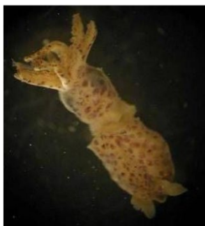
18 ヒメイカ Idiosepius paradoxus (Ortmann, 1881)。4mmML, 長門市油谷川尻沖, 1989 年 7 月 13 日, 河野光久採集, 萩博物館所蔵 (液浸:HH-Mo. 00546), 写真 (河野光久撮影)。