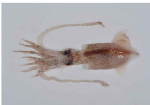
27 カギイカ Moroteuthis loennbergii Ishikawa & Wakiya, 1914。対馬北東沖 (山口県北西沖), 2012年10月25日, やまぐち丸採集, 萩博物館所蔵 (液浸:HH-Mo.01921)。