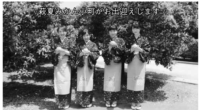
萩夏みかん小町がお出迎えます!

内 まつり会場で画用紙を配布し、夏みかんのキャラクターを募集。審査・表彰後、作品は旧田中別邸に展示。大賞に選ばれたキャラクターはチラシ等に活用!