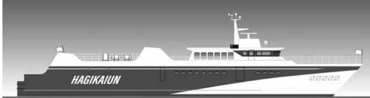
新船のイメージ図