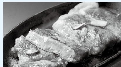
見蘭牛ロースステーキ