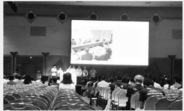
昨年度のプレゼンテーション審査の様子

越ヶ浜地区では地元の子どもの自分たちの住む地域の「大地と人のつながり」を知ってもらう体験プログラムの実践を5月12日に行います。少しずつ活動が目に見える形になってきました。