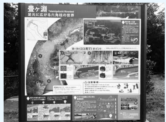
壺ヶ淵駐車場に設置した案内板

今回設置した案内板は、弥富にある農産物販売施設の一らるSHOP 315、壺ヶ淵駐車場、そして南の玄関口となる道の駅あさひ駐車場の3か所です。この案内板は、来訪者に分かりやすく説明するという目的はもちろん、この案内板を利用して良いガイドができるよう、地域の皆さんと協議して作製しました。平成30年度も2か所の設置を計画しています。