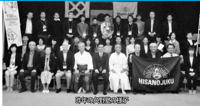
昨年の久野塾の様子