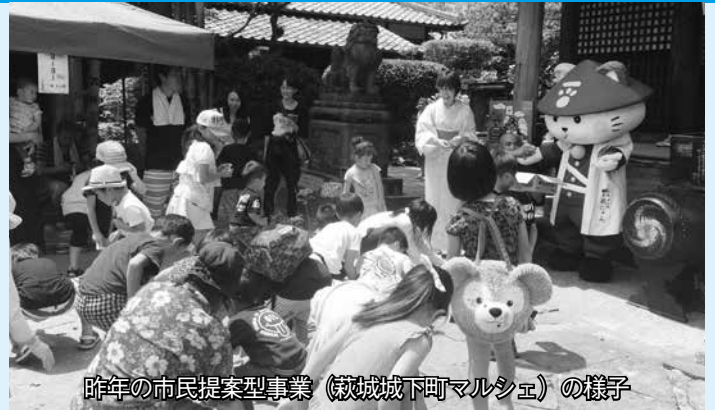
昨年の市民提案型事業(萩城下町マルシェ)の様子

■助成額 事業実施経費に対し、原則20万円を限度に助成 ※対象経費の例:講師謝礼、器具類の借上代、広告印刷代等