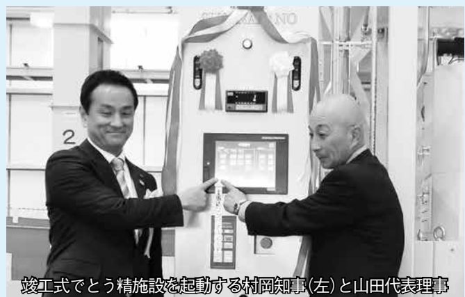
竣工式でとう精施設を起動する村岡知事（左）と山田代表理事