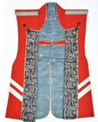
「猩々緋」色の生地が使用された陣羽織

しかし、16世紀にスペインが原産地を征服しヨーロッパに持ち込み、多くの染織物に使用されました。これが南蛮貿易を通じ日本にもたらされ、陣羽織の生地として定着していったのです。