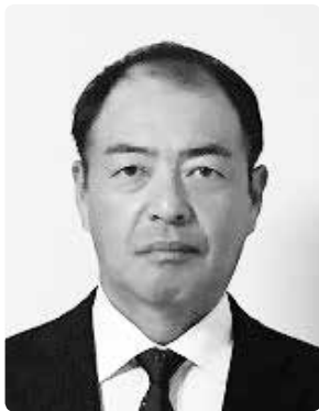
長尾産業戦略部長

平成30年度に新設した産業戦略部は、新たなまちづくりの基軸である産業振興を推進するため、産業政策の立案や全体調整を進めていきます。