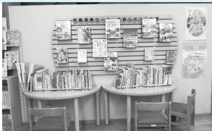
寄付金を活用して整備した萩図書館の児童図書コーナー