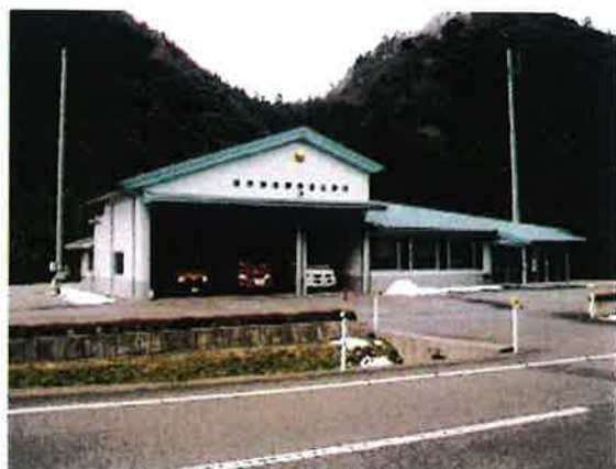
萩市消防署弥富出張所