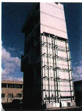
萩市消防署訓練塔