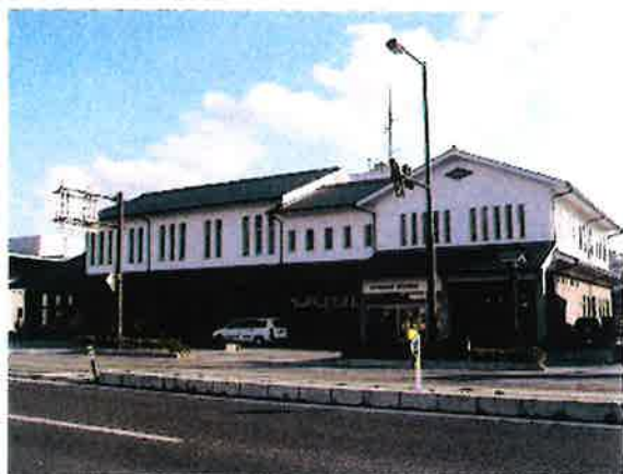
萩市消防本部・消防署