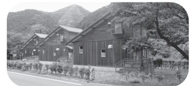
川上温泉隣接の池ヶ原交流促進施設

答 夏木原交流施設は佐々並地区と山口市との境にあること、見島ふれあい交流センターは離島にあるなどの地理的条件や、年間の使用シーツ枚数が少ないという事情があります。その一方で、萩セミナーハウスは市の中心部にあり、年間数千枚の使用があります。このような地理的条件や使用枚数の違いにより各施設で努力はされていますが、差が生じてしまうことから、やむを得ないと考えています。