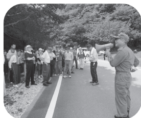
避難訓練のようす

図 女性や障がい者の目線を取り入れた、分かりやすい一般市民向けの「避難所運営ガイド」を新たに作成していきたいと考えます。