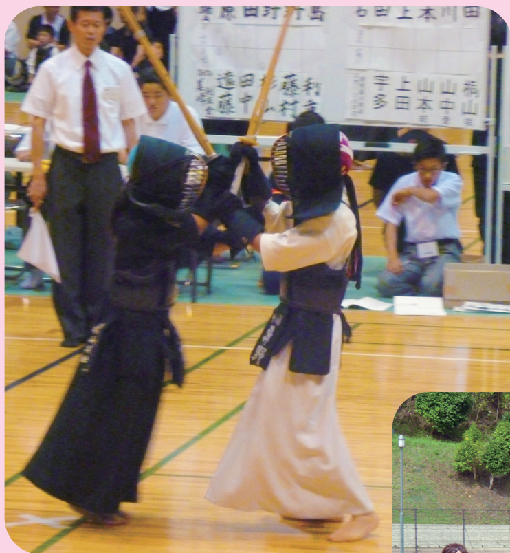
旧萩藩校明倫館“有備館”剣道大会

編集／萩市議会広報委員会 発行／萩市議会 〒758-8555 萩市江向510 TEL 0838-25-3144