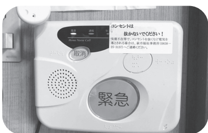
緊急通報システム装置