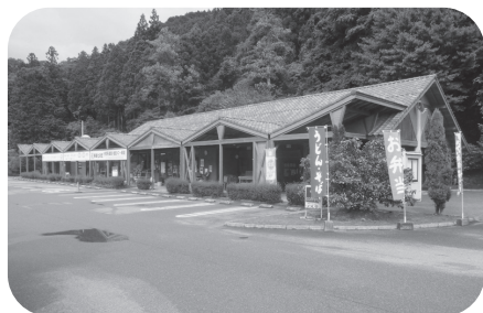
特産品販売所「つつじ」