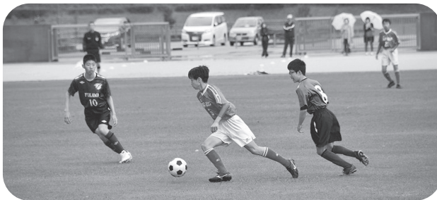
中学生のサッカー風景

○ 買い物弱者に関する調査はしておりませんが、実態については認識しています。事業団体への支援については国・県に対し要望していきます。買い物弱者対策は、地域公共交通網形成計画策定の中で検討します。