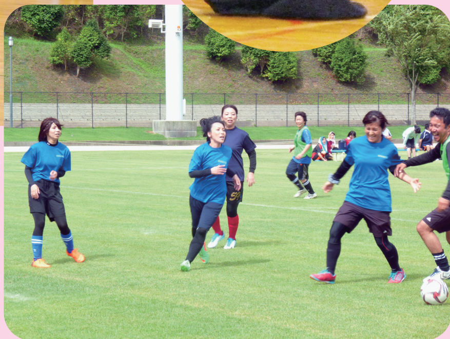
萩市サッカーフェスティバル