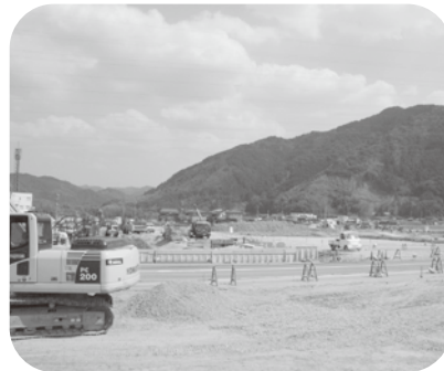
大型店建設予定地

かに初動防疫体制が図れるよう 「萩市高病原性鳥インフルエン ザ防疫初動マニュアル」を作成 し、関係部署及び県との連携を 密に情報を共有し即応できる組 織体制を整備しています。