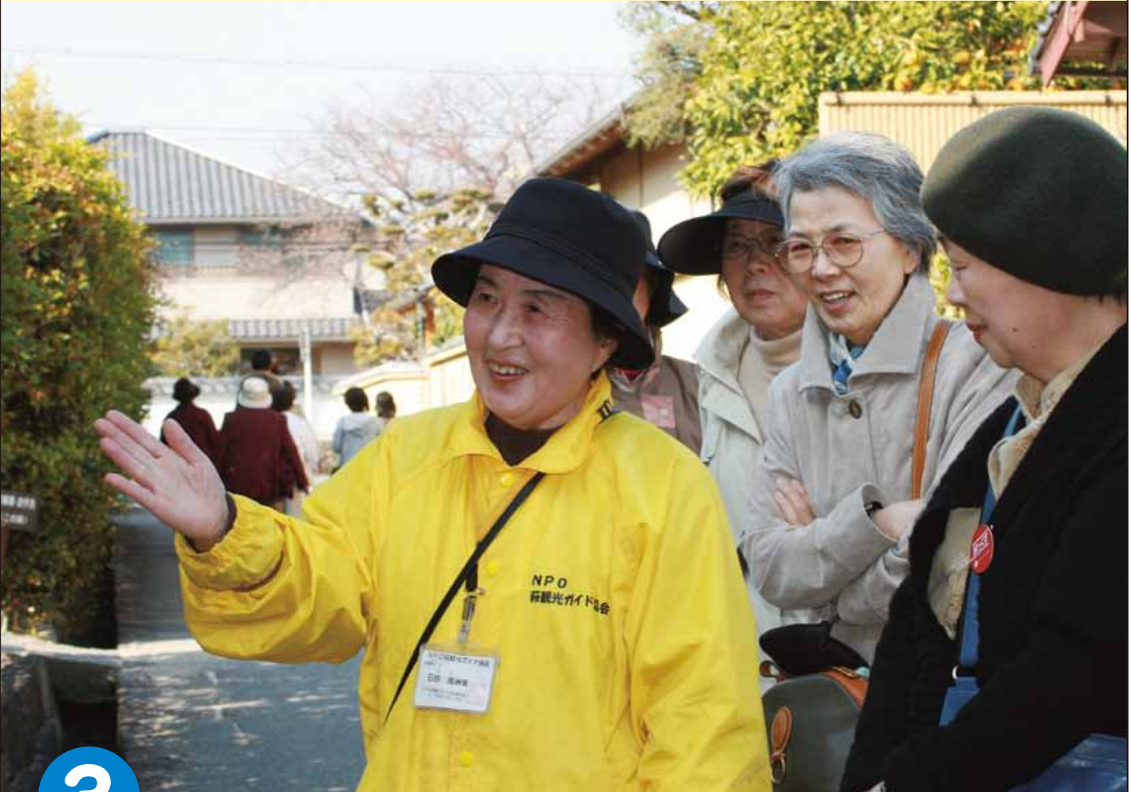
城下町を案内しているボランティアガイド

編集/議会だより編集委員会 発行/萩市議会 〒758-8555 萩市江向510 TEL 0838-25-3131