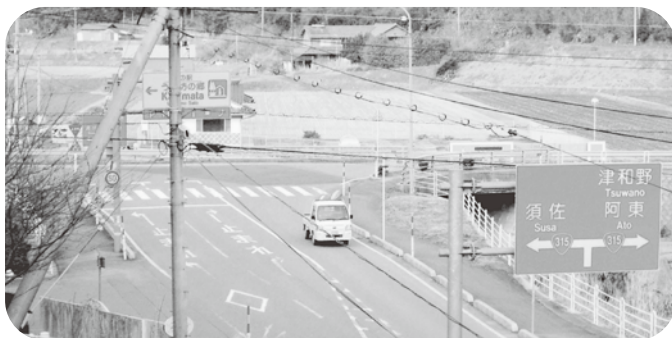
うり坊の郷交差点

れます。大惨事が起こる前に、市民の声を是非県に届けて欲しい。【答】この交差点は、県道萩津和野線に一旦停止の規制を設け、通行上の安全対策を取っていません。交通量の少ない交差点では、信号機を設置すると交通の流れを阻害するということもあり、現状では、信号機の設置はかたがた厳しい状況にあります。現在、県道萩津和野線は、改良を行っていることから、交通量の増加等の状況により、道路管理者や関係機関と連携を図り、検討していきます。