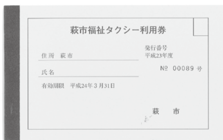
福祉タクシー利用券

また人工透析のため通院されている方は、通院回数により枚数を追加交付し、負担軽減に努めています。厳しい財政状況の中、本制度の維持継続を図るよう努めていきますので、ご理解をお願いします。