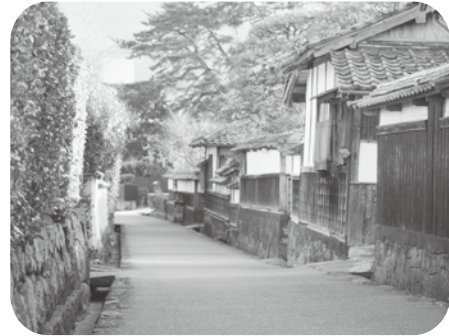
萩城下町 江戸屋横丁

より行政が受ける形が望ましいと考えます。市ではいつでも受け皿となる基金を設ける用意はあり、対応できるような準備も進めていきます。