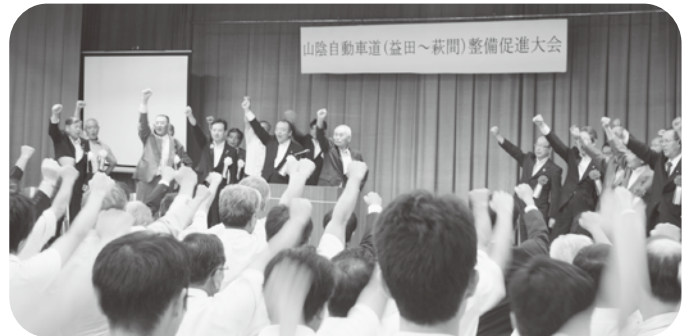
山陰自動車道整備促進大会

【答】昨年八月、萩市で開催した整備促進大会では、350人の市民が参加され早期整備の必要性をアピールしたところです。今後の取り組みについては、昨年より県内の全線整備を目的として設立した、萩市・長門市・下関市・阿武町・益田市の4市1町という新たな枠組みで要望活動を始めたところです。早期整備に向け、県も継続的に国に要望しています。今後も行政・議会・市民が一体となって繰り返し要望していくことが重要と