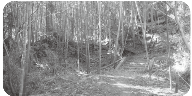
指月山登山口の竹藪

【答】指月山の登山口周辺はモウソウチクが繁茂し、手を打たなければ更に拡大すると考えられます。竹の伐採については、平成二十三年度予算においては、モウソウチクの伐採のほか、北東側斜面に繁茂しているマダケの伐採も計画しています。指月山を守ることは共通の認識とされていますのでご協力をお願いします。