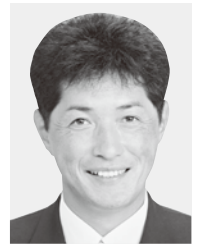
宮内 欣二 (日本共産党)