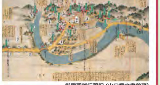
御国廻御行程記 (山口県文書館蔵)

橋本橋から延びる街道が濁淵の辺りで御成道と赤間関街道とに分かれ、御成道の途中から椿八幡宮への参道も伸びていました。三角州側から橋本橋を渡った辺りは「雑色」という下級武士の家が並んでいて、これが「雑式町」という小字の由来といわれています。小松江の辺りまで水が入って湾のようになっていました。水量を調節するために設けられた樋の跡が残っています。