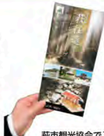
萩市観光協会で購入可能

萩往還は、毛利氏が慶長9年（1604）の萩城築城後、江戸への参勤交代のための「御成道」として開かれ、日本海側の萩から瀬戸内海側の三田尻港（防府市）までをほぼ直線で結ぶ全行程53kmの街道です。山陰と山陽を結ぶ重要な交通路であり、幕末には、多くの志士たちが往來しました。