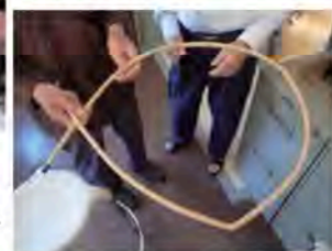
フチで作ったホテ