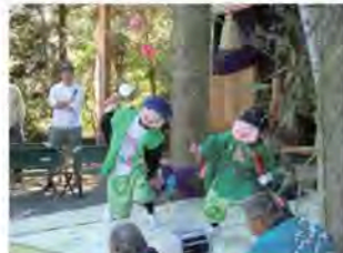
恵美須舞・大黒舞