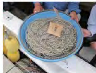
延縄を入れる鉢。フチの部分に針を引っかける。昔はワラを巻き固めたもの（ホテ）をフチに巻いて針をかけていた。

釣る魚の種類によって、アマダイ（甘鯛）ならば「アマ縄」、フク（河豚）ならば「フク縄」などと呼ばれます。昭和45年（1970）ごろには、このアマ縄漁に携わる大船が、玉江浦だけで約80艘あったそうです。アマ延縄漁が盛んになる以前の玉江浦では、フカ（サメ）をとるフカ縄漁が大変に盛んに行われていました。