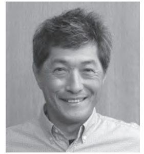
宮内 欣二 (日本共産党)