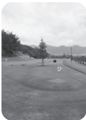
陶芸の村公園グラウンドゴルフ専用コース

なお、陶芸の村公園グラウンドゴルフ専用コースは利用者が少ないことから、陶芸の村公園の一層の利用拡大を図るため、今後利用料金の見直しを検討します。