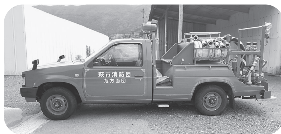
現在の明木第3分団の積載車

なお、消防署の消防ポンプ車は、山口県の緊急消防援助隊の消火隊として登録を行う予定です。