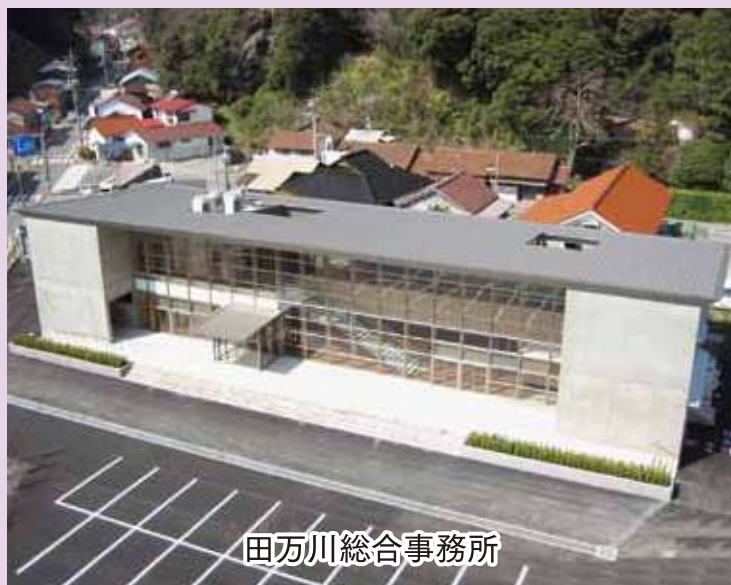
田万川総合事務所

発行 / 萩市議会 編集 / 広報委員会 〒758-8555 萩市江向510 TEL 0838-25-3144