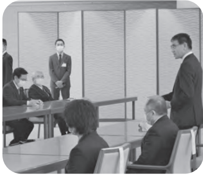
防衛大臣から説明を受けている様子

問 イージス・アシヨア「停止」を防衛大臣が示しました。ブースターが演習場外に落ちる可能性を認めて「住民の安全安心」は守れない「国益」にかなわないと防衛省自身が明らかにしました。この際、まちづくりにも大きな影響があると、はつきりと白紙撤回を求めるべきではありませんか。