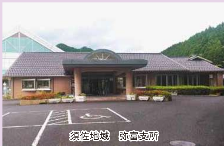
須佐地域 弥富支所

クイズ 萩にゃん。をさがせ 議会だよりのどこかに“萩にゃん。”がいます。どこにいるかな？