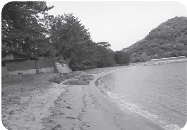
民間地までの浸食状況 (菊ヶ浜)

引き続き早期整備を要望していきます。西の浜海岸では、平成28年度から市が浸食対策工事を開始し、効果を確認していますので、引き続き現在の工事を進めます。離岸堤などの整備など、抜本的な対策については、県と連携して取り組んでいきます。 また、橋本川河口における砂の堆積に対して平成30年度に砂防堤を整備しましたので、引き続き、航行に必要な水深の確保に努めていきます。