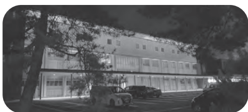
ブルーライトアップされた総合福祉センター

からも日々のご努力で患者や利用者の皆様を守ってくださいありがとうございます。そのご努力は、医療崩壊を防ぐことに繋がっています。本市でも医療従事者・介護従事者などに感謝とエールの気持ちを何らかの形として支援することが重要と考えます。市長の見解を伺います。 答 国の第2次補正予算で、医療・介護・福祉従事者を支援するための慰労金が支給されることになりました。市では、医療従事者や介護従事者などの皆様への感謝とエールの気持ちとして、萩市総合福祉センターでブルーライトアップを実施します。〈その他の質問〉 ■GIGAスクール構想について