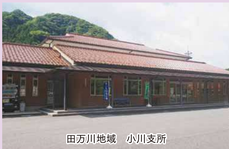
田万川地域 小川支所