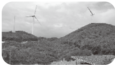
風力発電施設 (白滝山：下関市)

響を与えることがあってはいけません。このため、環境影響評価の第一段階である計画段階環境配慮書に係る萩市の意見を8月に山口県へ提出しました。この中で、発電所からの騒音等について最新の知見に基づく処置を講じ、影響を回避または十分に低減することや、災害の発生や生態系、景観への影響等に配慮することを求めています。この事業が住民の平穏な生活を脅かすものであれば看過できません。萩市の進めるまちづくりへの影響がないよう注視することも、引き続き環境保全の見地から、事業計画に対する意見を機を逃さず述べていきます。