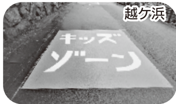
キッズ・ゾーンの路面標示