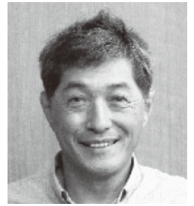
宮内 欣二 (日本共産党)