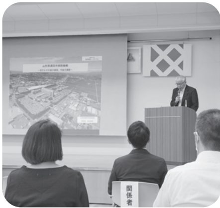
将来の萩の医療を考えるシンポジウムの様子

今後、中核病院の経営シミュレーションを協議、検討する段階で、必要に応じて萩市民病院や都志見病院から財務に関することも説明を求め、持続可能で安定した病院経営に向けた検討を行っていきます。