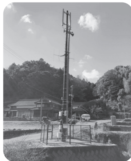
すでに整備された移動通信用無線設備

答 携帯電話の不感地域においては、市が実施主体となり施設を整備したうえで、通信事業者にサービスの提供を行ってもらうものであり、それにより地域間の格差解消を図るものです。そのために今回は弥富地区の基地局となる6基について、アンテナや無線設備などを購入し取り付けするものです。