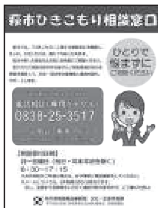
ひきこもり相談窓口のチラシ

今後は、ひきこもり対象者の実態把握を行うとともに支援等を行う人材の育成に努め、ひきこもり対策の一層の充実を図っていきます。