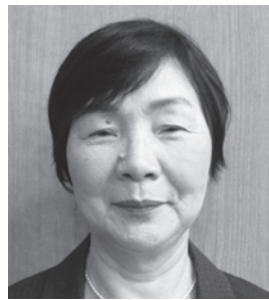
佐々木 公 恵 (公 明 党)