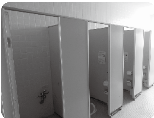
学校の女子トイレ

答 この問題に限らず、児童生徒の様々な悩みや相談に対し、校内で迅速かつ適切に応じることで、教育相談担当教員を中心とした体制を整備しています。生理用ショーツについても、児童生徒の求めがあれば対応できる体制を整えています。