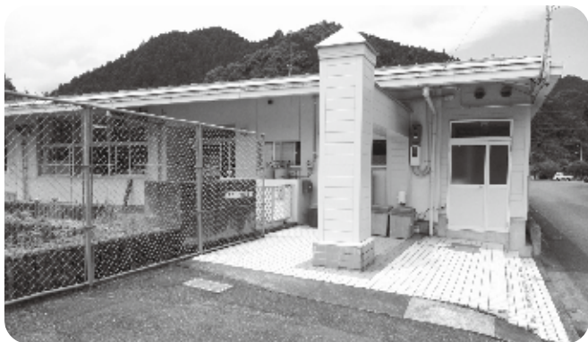
左表紙 川上保育園

みなさんのびのびとして、笑顔が素敵です。木材を使った遊具が特徴です。いつも10人で元気よく遊びまわっています。地域や小中学校といっしょにいろいろな行事をしています。