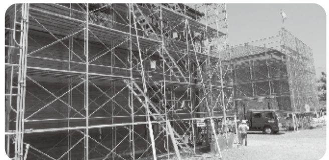
改修中の旧明倫小学校3・4号棟