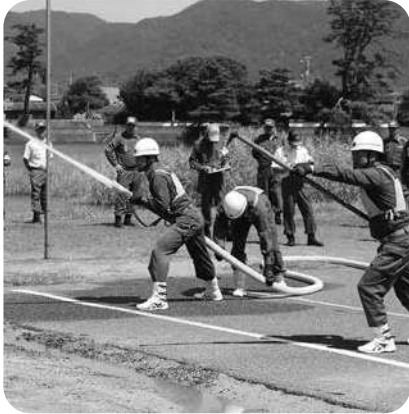
消防団活動の様子

答 国から全国の自治体に、消防団員の処遇の改善等について、積極的な取り組みを行うよう通知されたところです。萩市としては、今後、県内の動向を見ながら、消防団員の処遇の改善や消防団員の確保、消防団の充実強化につながるよう報酬の見直しを検討していきます。