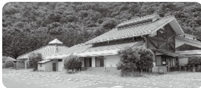
改修前の萩田万川温泉センター

答 財源に国の地方創生拠点整備交付金を活用することから、来年3月18日までに完成させたいと思います。