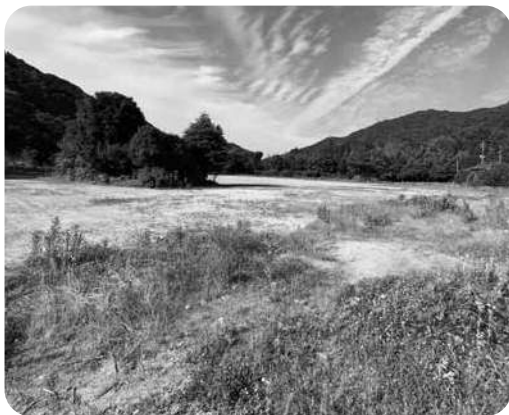
旧明木中学校跡地

人口定住策については、地域内から人が流出しないよう取り組むことはもちろんのこと、地域外から地域内に人を呼び込むことが必要です。旧明木中学校跡地については、居住用や事業用としての活用方法を検討しています。