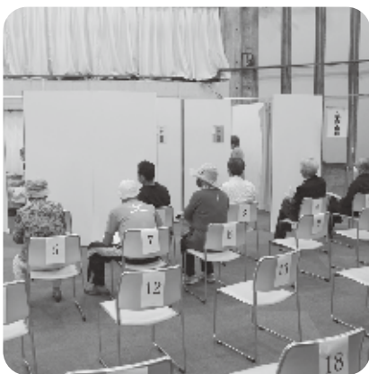
新型コロナウイルスワクチン集団接種の様子

答 集団接種の予約では、コールセンターへの電話よりインターネット予約の方がやや多い状況です。今後、集中が予想される時期は電話回線を増やします。また、一般の方は、年齢区分で予約開始時期をずらします。なるべくホームページやアプリでの予約をお願いするとともに、予約方法のご案内など支援に努めます。