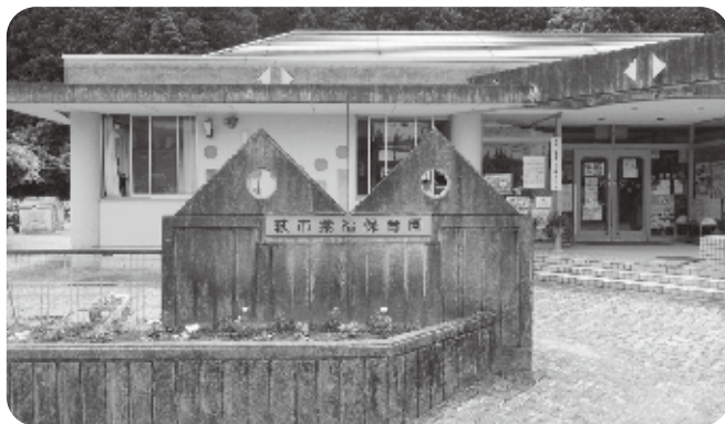
紫福保育園 右表紙

6月の遠足で陶芸の村公園に行きました。楽しく遊びました。6人全員で写真を撮りました。福栄地域には、紫福保育園と福川保育園があります。