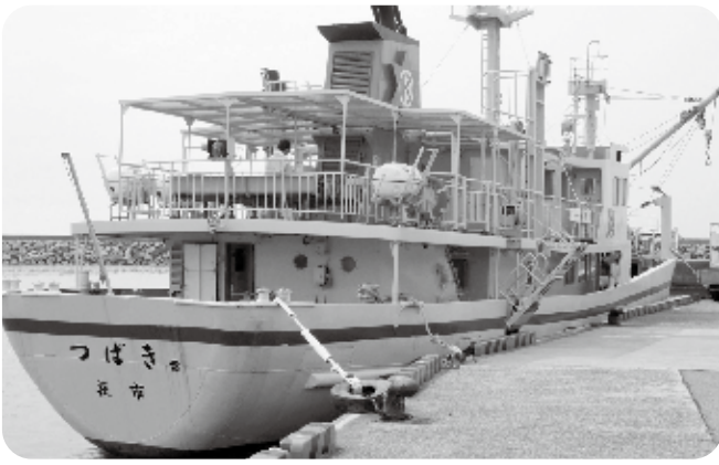
現在の相島航路 定期船：つばき2

問 船体重量が計画より大幅に超過しており、船舶建造工事請負契約違反であるため、契約解除を決定したとの報告がありました。相島住民の皆様が、新船を待ちわびておられたことを思うと残念でなりません。今後の