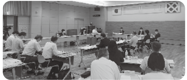
以前の中核病院形成検討委員会

答 新たな組織でそういった期待の声も出てくると思います。意見として報告をいただき、最終的には市で判断します。