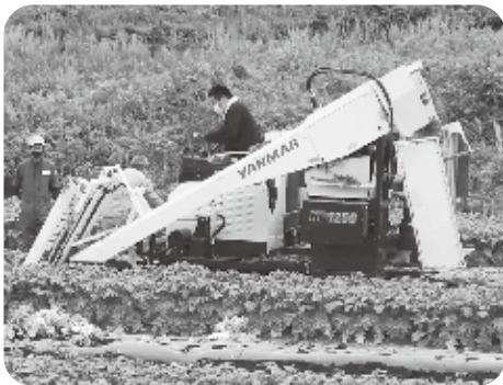
千石台の大根収穫機導入事例

答 スマート農機やシステムの導入、機械化による作業の効率化は、農業者の高齢化対策や担い手不足解消の手法として有効であることから、国・県・市等の制度により、引き続き支援をしていきます。