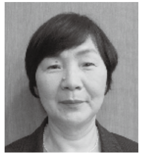
佐々木 公恵 (公明党)