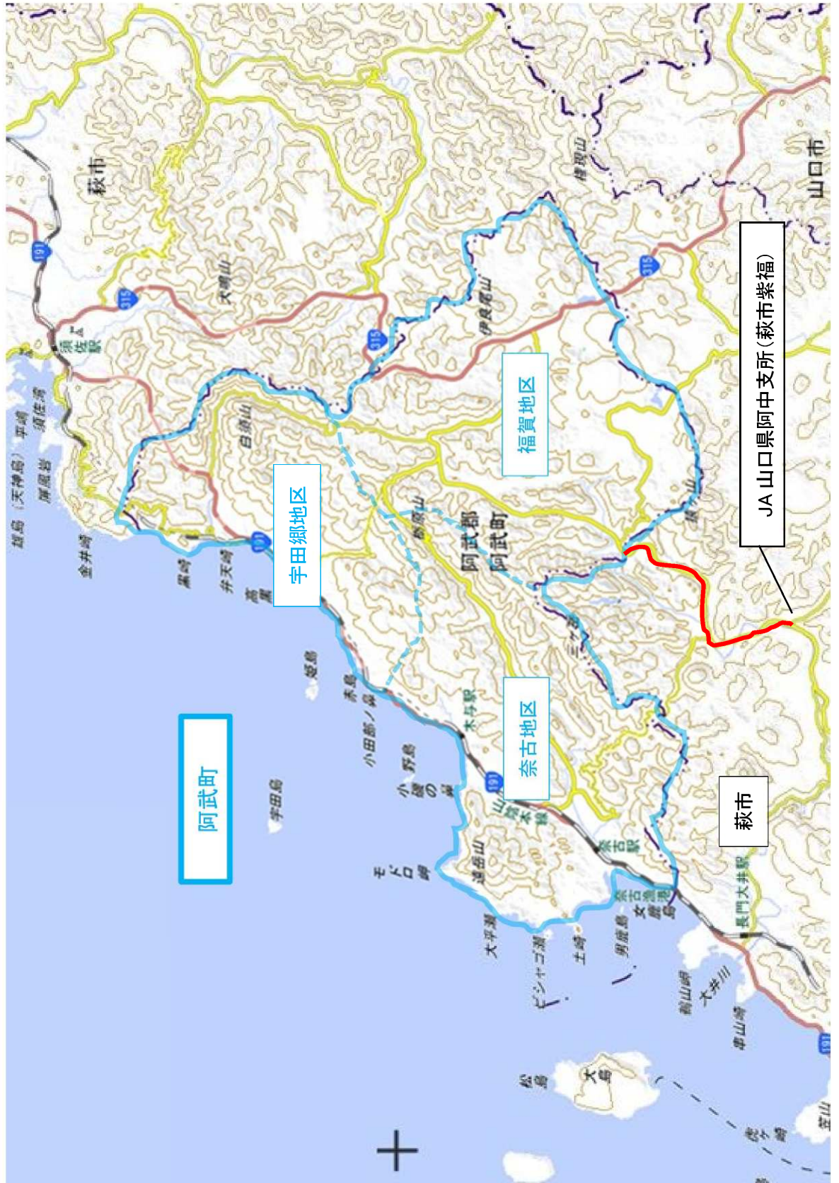
阿武町概略図 (※赤線経路が萩市)