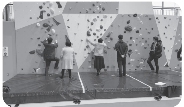
現地確認したボルダリングウォール