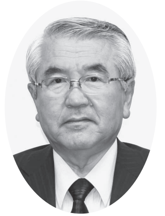
萩市議会議長 横山 秀二