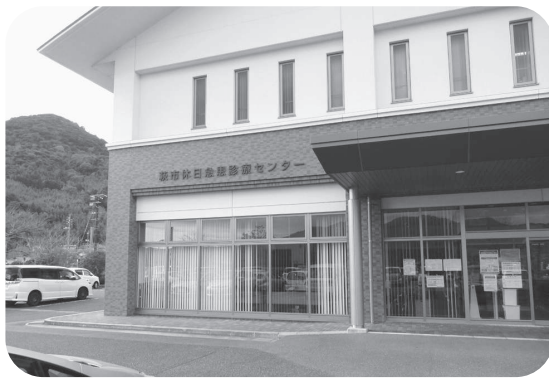
萩市発熱外来・検査センター (萩市休日急患診療センター前に開設)

市では、引き続き事業者の皆様と感染予防対策の徹底に取り組むとともに、医療資源なども限られるため、まずは、発熱等の症状のある方が、費用負担がなく確実に行政検査が受けられる体制の確保に努めていきます。