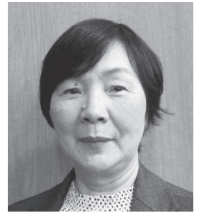
佐々木 公恵 (公明党)