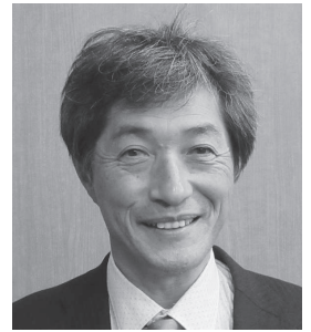
宮内 欣二 (日本共産党)