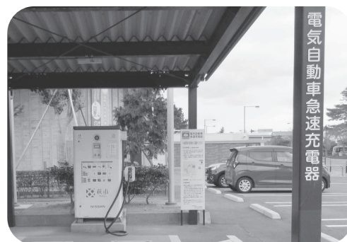
市役所の電気自動車急速充電器

答 電気自動車の障害は航続距離であり、それを延ばすためには電池容量を大きくし、充電時間を短くすることです。そこで改正された高出力の急速充電設備が必要となります。