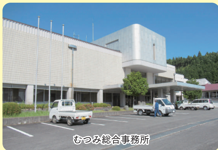
むつみ総合事務所