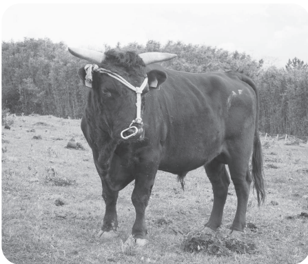
見 島 牛

本年も市議会に対しまして格別のご 理解とご協力をお願い申し上げますと ともに、市民の皆様のご健勝とご多幸 をお祈り申し上げます。