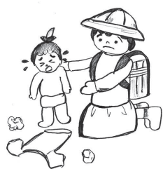
ヤングケアラーの様子

答 これまでの取り組みは、まだまだ途上であり、明日の萩市のために、やらなければならぬことは山ほどあります。引き続き、それらを実現して、市民の皆様が「暮らしの豊かさを実感できる萩市」を創ることが私の責務と考えています。