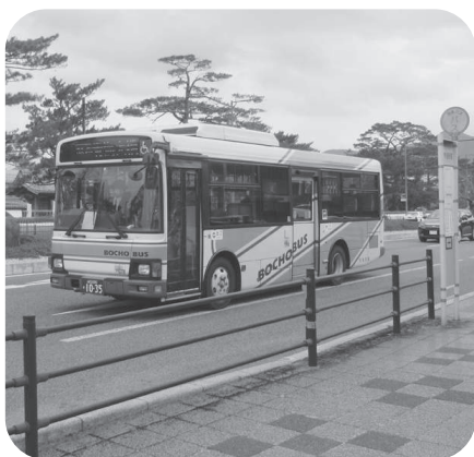
学生が利用する路線バス

市内に居住しているのに、市外へ通学している場合、別の支援策が必要ではありませんか。保護者の方への経済的な支援の方法を検討します。また、県に通学支援制度の創設を要望しています。