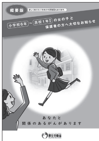
▶ HPVワクチンに関するお知らせ (厚生労働省)

は、平成25年度は56人（31・5%）で、以後、0人が続き、令和元年度は1人（0.4%）です。本年10月、国から「接種を勧める内容ではなく、子宮頸がんワクチン接種に関する情報」としてリーフレット等関係者に届ける方針が示されました。これを受け、市では接種対象者となる小学6年生から高校1年生までの女子と保護者宛にワクチン接種に関する情報をお知らせしたところです。