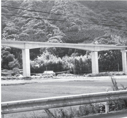
山陰自動車道の高架橋 (三見)

なお、道路建設に伴う既存の市道・農道・用排水路等の機能復旧については、今後、説明会等で地域の皆様や管理者の方々の意見を伺いながら計画を進めて行くとのことですので、建設計画の進捗には影響しないと考えています。