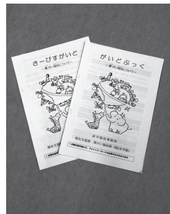
「さーびすがいど」と「がいどぶっく」

答 各種手当や年金などの制度や支援を紹介した「がいどぶっく」、障がい福祉サービス内容を紹介した「さーびすがいど」を配布し、情報提供をしています。65歳になると介護保険サービスに切り替わり、支援する人が変わるため、利用者の心のケアが重要となります。このため、相談支援専門員とケアマネージャが協力しながら支援を行っています。