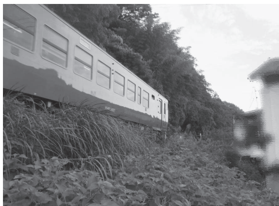
人家裏のJR斜面の雑草が繁茂している様子

答 市では毎年、県を通じてJR西日本に対し、鉄道施設の維持管理や昼間時間帯の運行便の確保等の要望を行っています。引き続き、計画的な施設の維持管理について、強く要望を行っていきます。