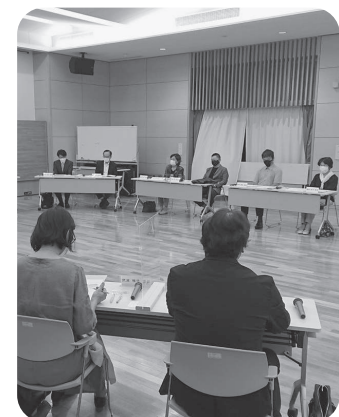
中核病院協議会の様子

答 ランニングコストは診療科や医療機能などをどうするかで大きく変わります。協議会には病院運営に関する具体的な検討・協議をお願いしていませんが、中核病院の方向性を協議される上で必要な情報として、インシヤルコスト以外の一定の資料は示したいと考えます。