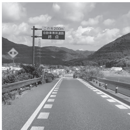
山陰自動車道の萩インター

また、予算を伴わない施策に ついては、関係機関等と調整を 図り、進めていきます。