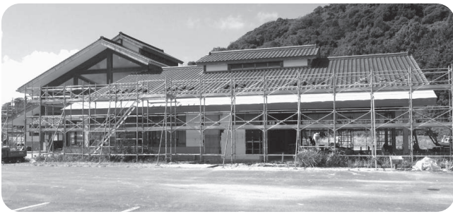
改修中の萩田万川温泉センター

答 大人(中学生以上)は410円→550円に、小学生は200円→250円に改定しますが、小学生未満は100円のままです。