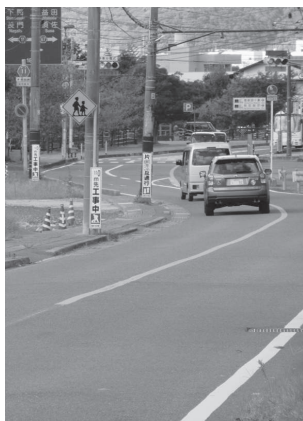
拡幅工事が進む松本地区の県道萩篠生線

問 道路拡幅工事が進む松本地区にガードレールは設置されま すか。千葉県八街市の飲酒運転 による児童死傷事故は二度と起 こしてはなりません。大型車の 通行も多く、危険性が予てから 指摘されており、設置されない なら県に要望しませんか。