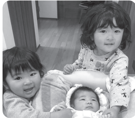
将来を担う子ども達

将来を担う子どものために予算を使うという考えであり、歳入確保の推進や歳出を抑える取り組みを行うことにより、財源の確保を図ります。