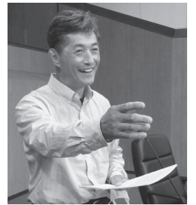
宮内 欣二 (日本共産党)