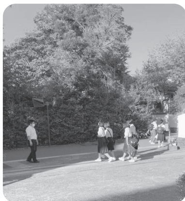
市内中学校の通学風景

に見直すことが必要であると考えています。校則の見直しにあたっては、子どもたちから出された要望をもとに、まずは生徒総会等の場で子どもたち同士が議論することが大切です。さらに、子どもの人権を踏まえて、教職員や学校運営協議会委員とも協議するなど、子どもたちが校則について主体的に考え、自主的に守ることを通して、自分たちの手でより良い学校生活を作ろうという意識を醸成することに教育的な意義があると考えています。