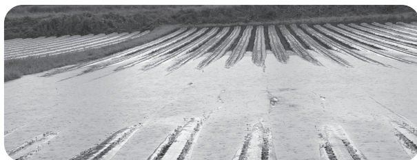
冠水した大根の圃場

的な被害が発生した場合に、市においても検討することとしています。 近年、自然災害等の多発など営農を取り巻くリスクが増加していることを受け、国が収入減少を補填する収入保険を制度化していますので、制度の周知を図っていきます。 今回、新型コロナの影響を受けられた方には、9月補正予算に計上した「一次産業事業者緊急サポート給付金」により支援してまいります。