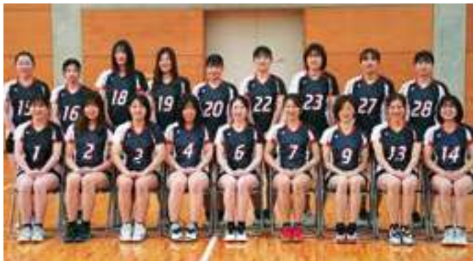
至誠館大学バレーボール部