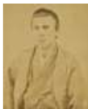
木戸孝允 肖像 (萩博物館蔵)