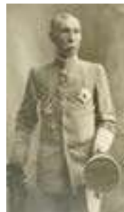
山県有朋 肖像