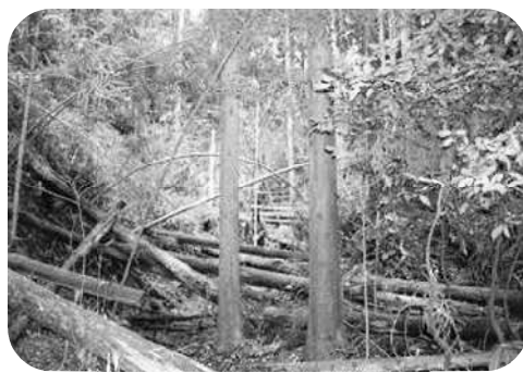
放置された私有林

ますが、今年度初めて事業実施するもので、しっかりとした対応をしていきたいと考えています。