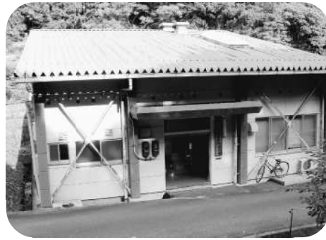
須佐給食センター

協力のもと、ポット苗植付けによるグラウンドの芝生化も事例としてあります。市教育委員会では、効果的な砂埃対策について研究しているところでです。