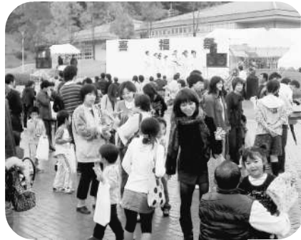
山口福祉文化大学 喜福祭

座・科目等履修制度・学会の誘致・施設開放などを通して地域に大いに貢献されています。北浦地域出身学生については、今年度から授業料を3割減免する制度を創設されました。なお、市でも市民を対象とした奨学金給付制度を設けています。