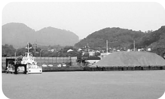
潟 港 (後小畑)

萩港を貿易港として今後どのように考えれば良いか、事業者とも協議をして方向性を検討していきたいと思えます。