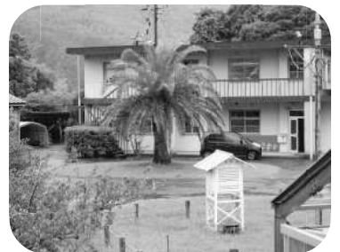
萩夏みかんセンター