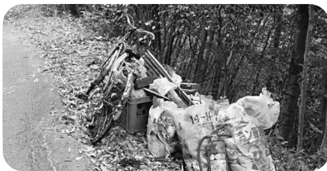
鹿背隧道付近の不法投棄