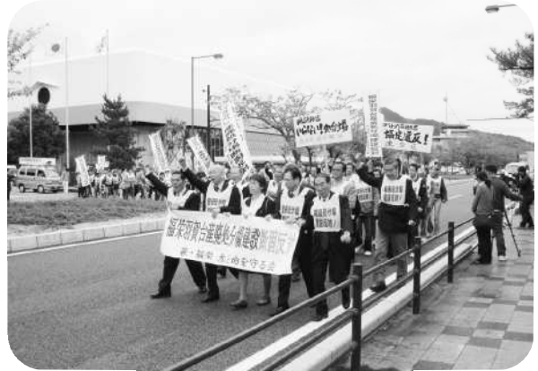
総決起集会デモ行進