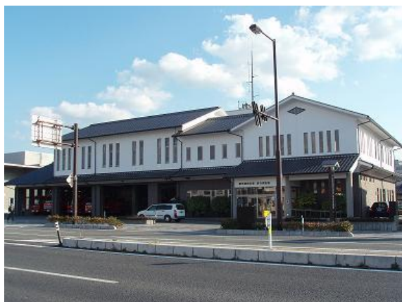
萩市消防本部・消防署