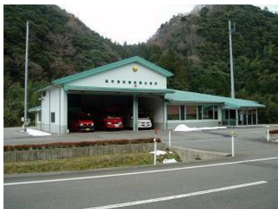
萩市消防署弥富出張所