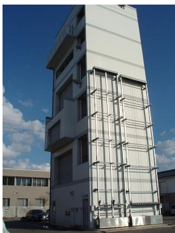
萩市消防署訓練塔