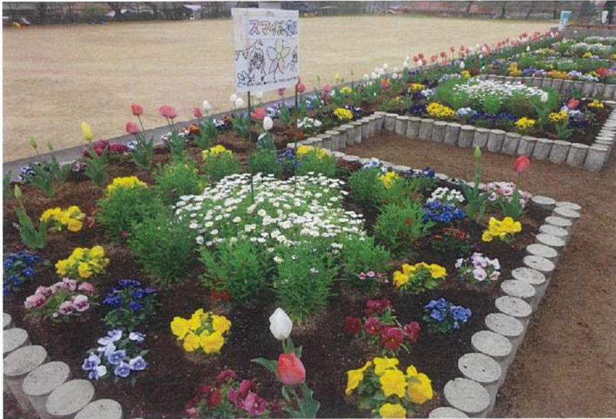
【学校の部】金賞（明るく楽しいで賞） 明木小学校・旭中学校