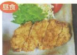
むつみ豚のコースとんかつ定食