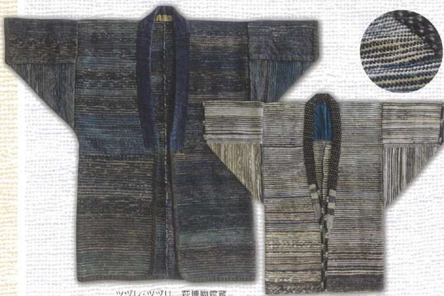
ツツレ・ツツリ 萩博物館蔵