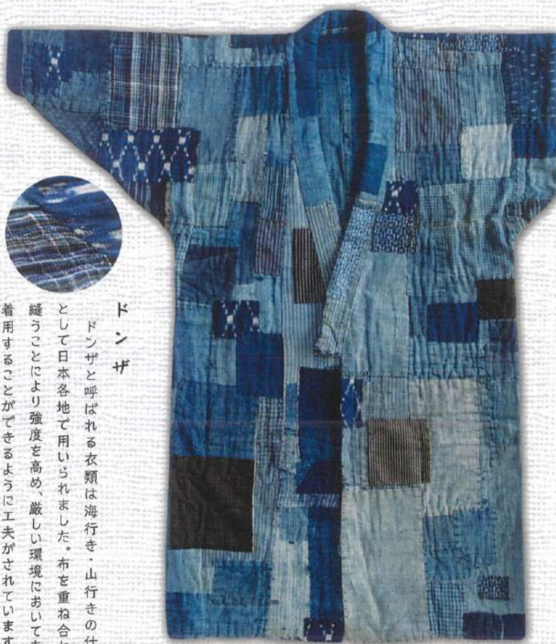
ドンザ 下関市立豊北歴史民俗資料館蔵 (登録有形民俗文化財)【公開：4/29～】

ドンザ ドンザと呼ばれる衣類は海行き・山行きの仕事着として日本各地で用いられました。布を重ね合わせて縫うことにより強度を高め、厳しい環境においても長く着用することができるよう工夫がされています。