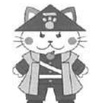
萩市のキャラクター:萩にゃん。