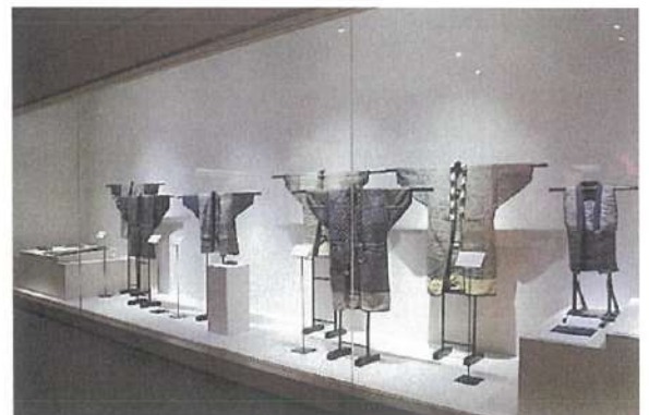
ドンザ（下関市立豊北歴史民俗資料館蔵）