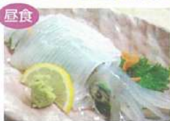
須佐男命いかの活き造り