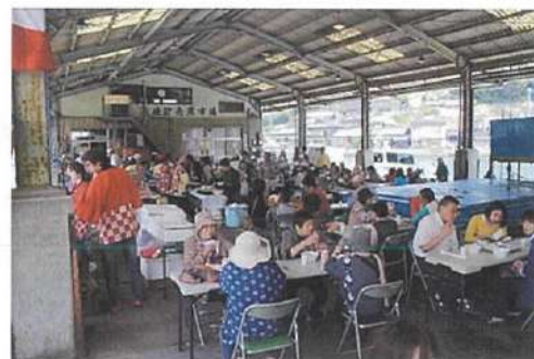
雑魚場食堂の様子