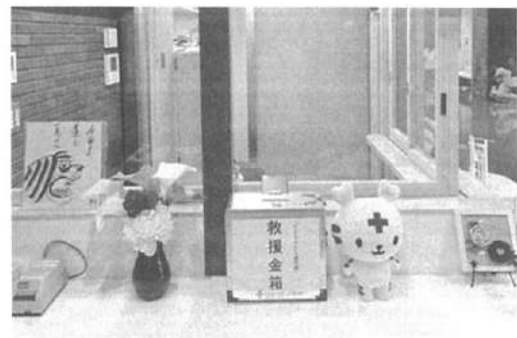
萩市総合福祉センター 設置場所