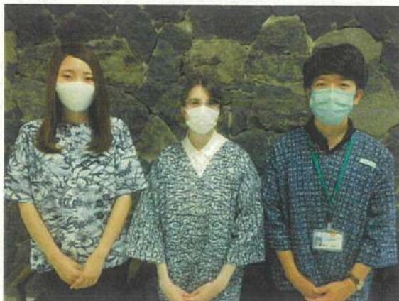
浴衣Tシャツの着ている様子