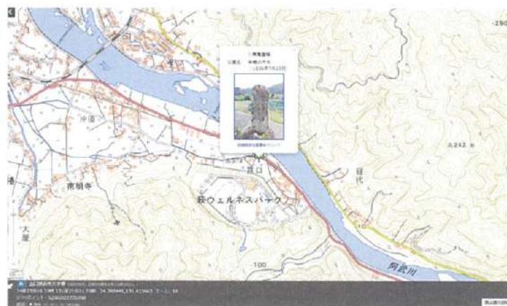
ウェブ地図「国土地理院」掲載の様子（三界萬霊等）

（参考）全国 415 市町村 1 4 0 5 基、山口県 4 市 20 基（2022 年 6 月 23 日現在）