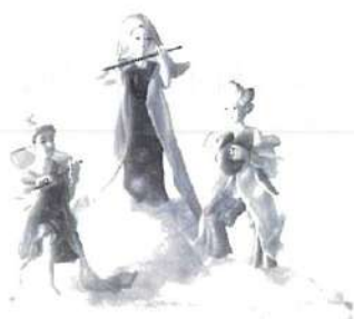
教育長賞 「天上人の調べ」