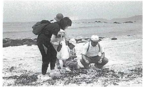
萩市郷土博物館時代

大学卒業後には家業を継いで市内で呉服屋を営みながらも、コレクターとして貝の収集を続けてこられました。さらに萩博物館の前身「萩市郷土博物館」時代には、「博物館学芸委員」として貝の観察会の講師を務めるなど、市内の子どもたちへの教育普及活動にも取り組んでこられました。