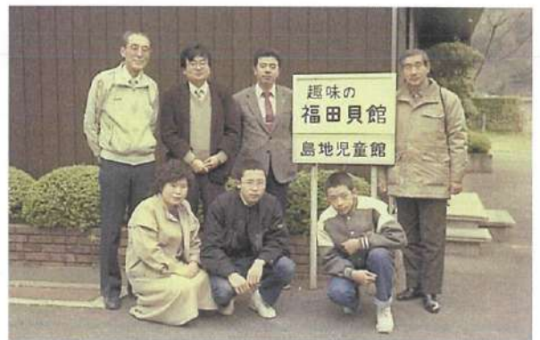
中学生の頃の堀研究員（前列中央）と

堀研究員は大学で貝をテーマに学位を取得し、やがて萩博物館の海洋生物担当の研究員となります。その後、毎年多くの親子連れで賑わう夏の特別展の担当として活躍しつつも、自身のテーマである貝に焦点を当てた特別展の構想を温め、勤務18年目で初めて貝専門の特別展を開催する機会を得ました。