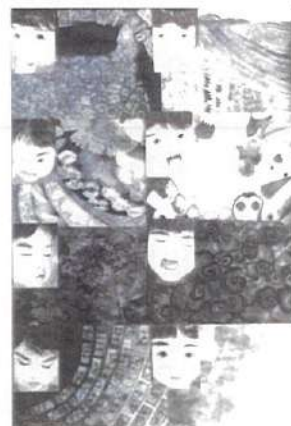
美術協会長賞 「思い出は」