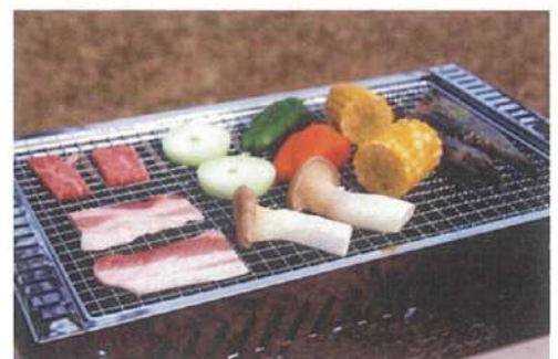
美味しい料理と素敵な音楽で夏を迎えます