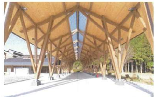
会場となる開放感溢れる多目的テラス