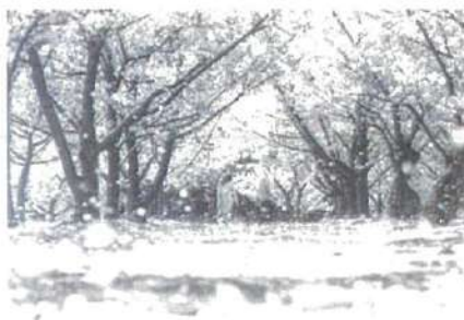
市長賞 「わぁ！雪みたいだよ！」