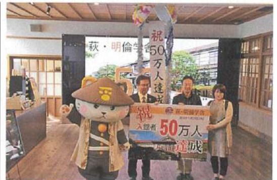
（50万人達成の時の様子）

記念品：「萩・明倫学舎」オリジナルグッズ、萩の特産品、 100万人達成記念グッズ等