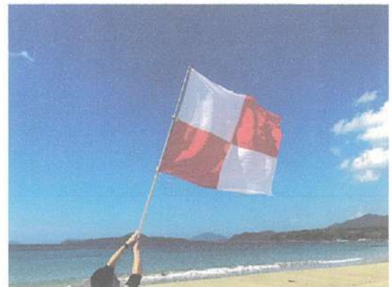
▲津波フラッグ（津波注意報等が発表されたことを周知し、避難の合図となる旗）

※来場者数 令和3年度 44,760人 令和2年度 37,012人 令和元年度 70,620人 平成30年度 106,570人