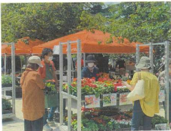
【これまでの開催の様子】