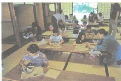
手びねりによる制作