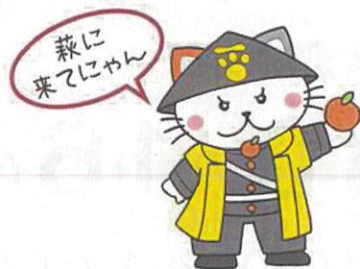
萩市キャラクター 「萩にゃん。」