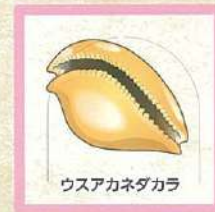
ウスアカネダカラ