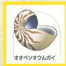
オオベンゾウムガイ