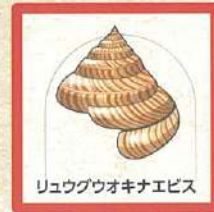
リュウグウオキナエビス