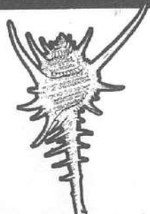
エンマノホネガイ

えんまだいおう ほね 閻魔大王の骨!? オセアニアの海からやってきた珍しいホネガイ。