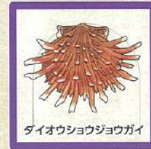
ダイオウショジョウガイ