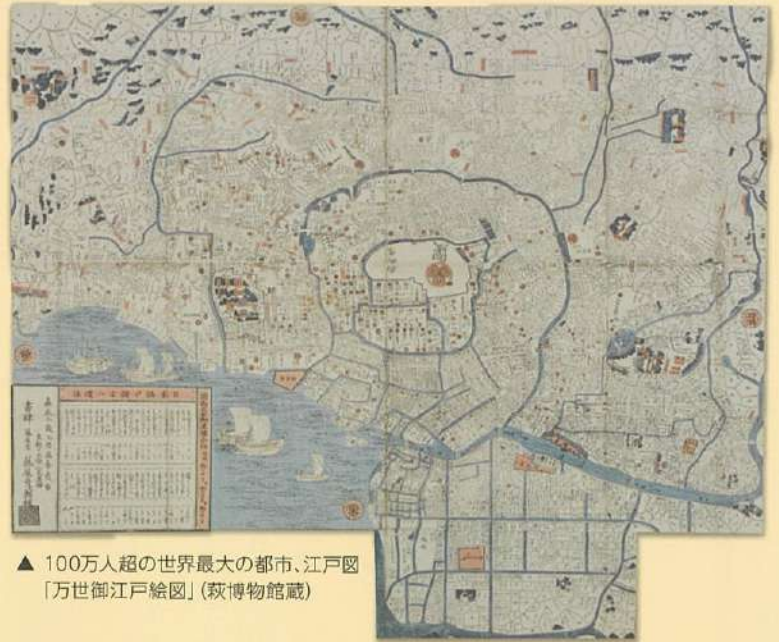
▲ 100万人超の世界最大の都市、江戸図 [万世御江戸絵図] (萩博物館蔵)