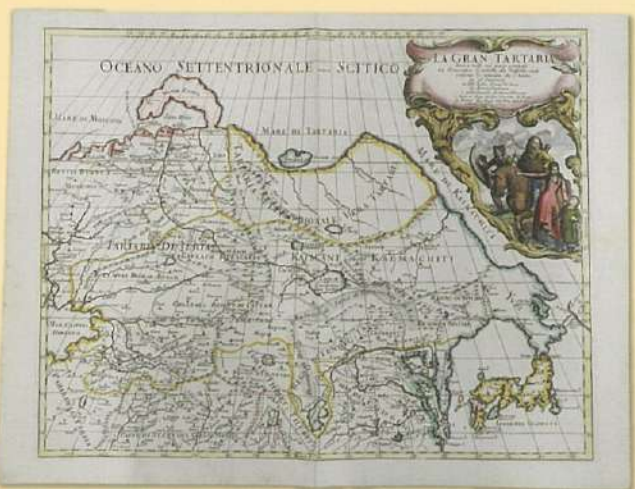
▲ ヨーロッパから見たアジア・日本の姿形 [LA GRAN TARTARIA (偉大なタルタリア)] (萩博物館蔵、おがわ是苦集)