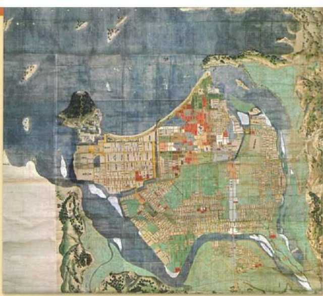
▲ 現存最大級、江戸中期の萩城下町絵図 [享保～延享年間 萩城下町絵図]

本展では、萩博物館が長年にわたり収集してきた膨大な資料の中から、江戸時代に作成された地図を中心に紹介します。それら古地図に描かれたふる里や国の姿かたちは、どのようなものだったのでしょうか。長州萩から日本、国外へと視野を広げ、魅力たっぷりの古地図の世界にいざないます。