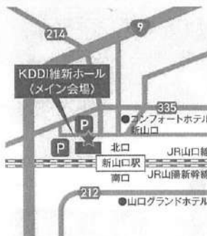
① KDDI維新ホール ★シャトルバス乗り場

③ ルネッサながと(関連イベント) (地域伝統芸能九州・山口大会) 10月9日(日)のみ (長門市仙崎10818-1) JR長門市駅より路線バス15分