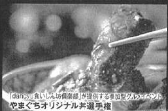
「dancyu食いしん坊倶楽部」が提供する参加型グルメイベント やまぐちオリジナル丼選手権