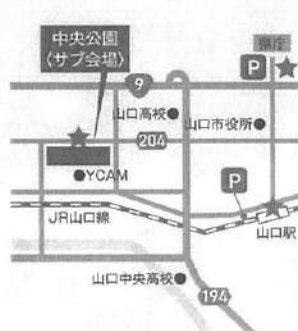
② 中央公園 ★シャトルバス乗り場