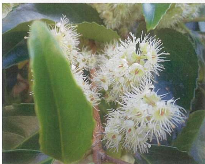
白い花と朱色の樹皮のコントラストがユニークです。