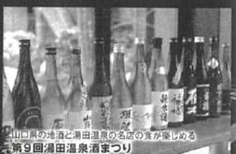
山口県の地酒と湯田温泉の名店の食が楽しめる 第9回湯田温泉酒まつり