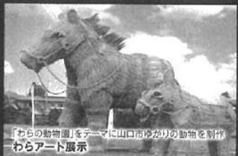
「わらの動物園」をテーマに山口市ゆかりの動物を制作 わらアート展示