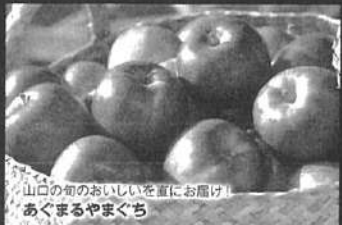
山口の旬のおいしいを直にお届け! あぐまるやまぐち