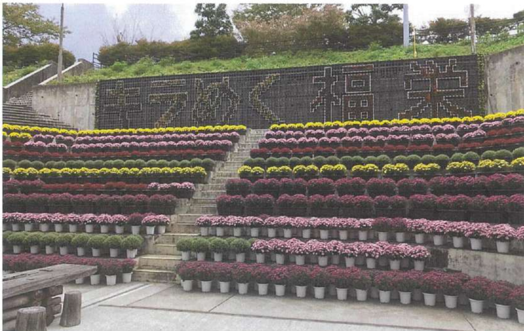
道の駅ハピネスふくえ ベルギーマム展示

（協議会の構成）花卉生産者および道の駅ハピネスふくえ、福栄文化遺産活用保存会 福栄コミュニティ協議会役員で構成