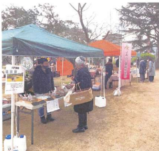
【これまでの開催の様子】