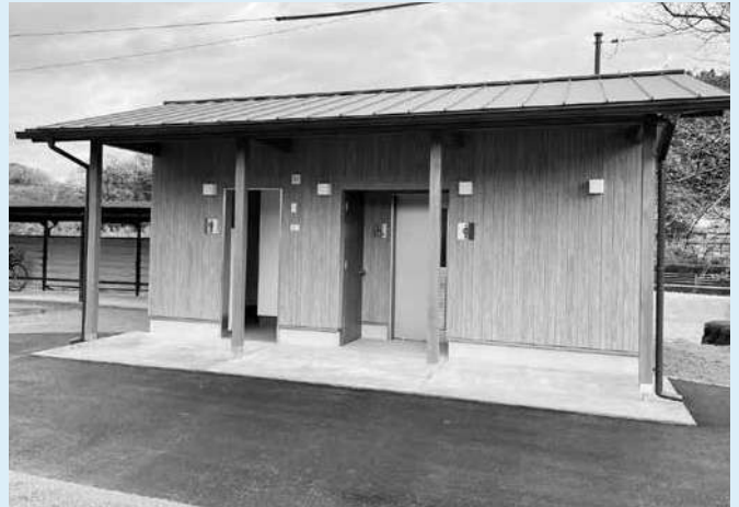
JR長門大井駅前の公衆トイレ