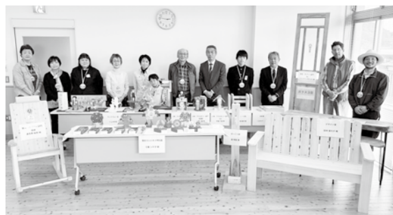
入賞作品と受賞者の皆さん