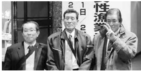
山口県漁業協同組合見島支店宇津支所 発表内容:見島の至宝「塩水ウニ」に輝きを