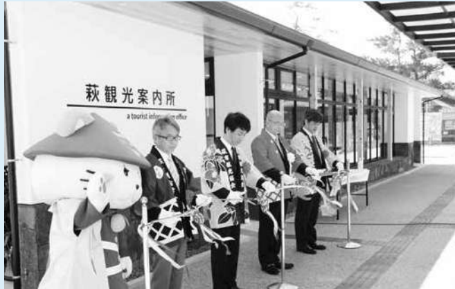
テープカットの様子