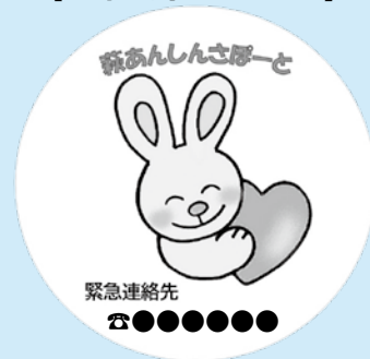
【登録者用ステッカー】