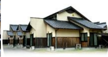
はいつ・ほたる (女性)