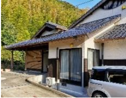
はいつ・びわ (男性)