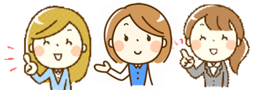
社会福祉士 主任介護支援専門員 保健師等

介護予防事業、認知症サポーター養成講座、認知症ボランティアの養成、徘徊・見守りSOS、その他認知症施策の推進など、様々な事業を行っています♪