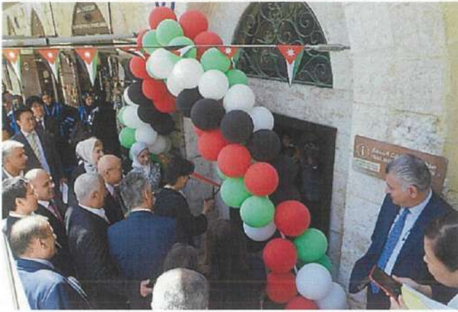
サルト歴史博物館エントランス