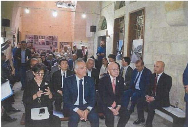
左:リーナ駐日ヨルダン大使、中央:観光・遺跡大臣 右:駐ヨルダン日本大使