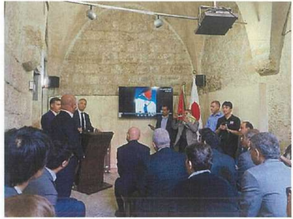
オープニング・セレモニー