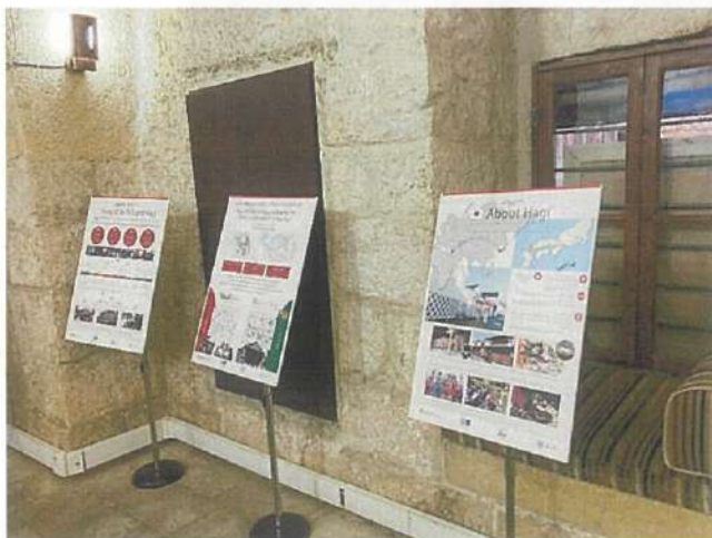
萩市とサルト市の連携を紹介する展示パネル