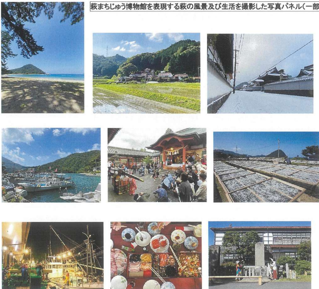
萩まちじゅう博物館を表現する萩の風景及び生活を撮影した写真パネル(一部)