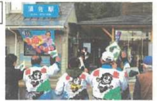
▲令和3年4月 須佐駅への初めての停車時の様子