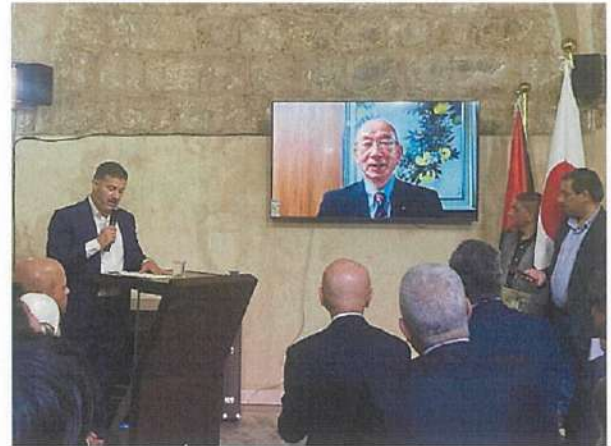
田中市長ビデオメッセージ