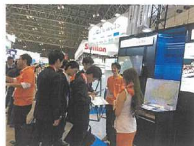
△Interop Tokyo 2019の様子