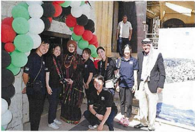
JICA 海外協力隊スタッフ