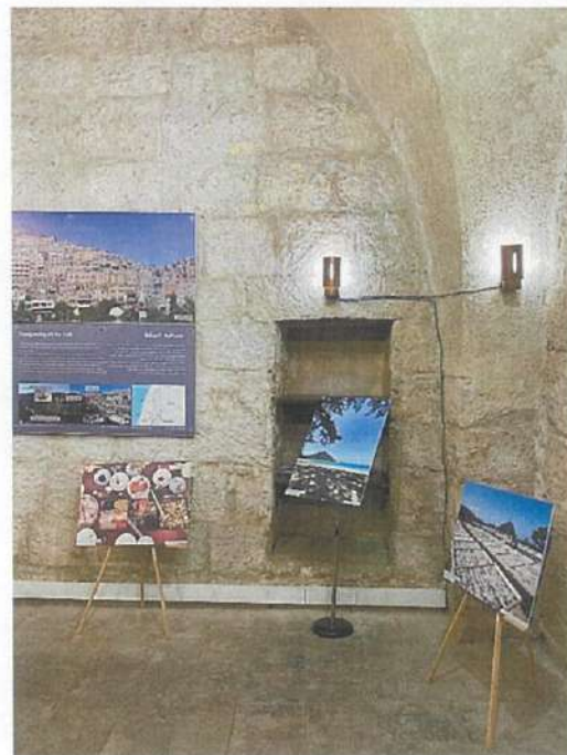
萩の風景及び生活を撮影した写真パネル