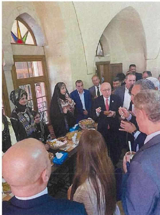
アラビック・コーヒーやアラブ菓子の試食