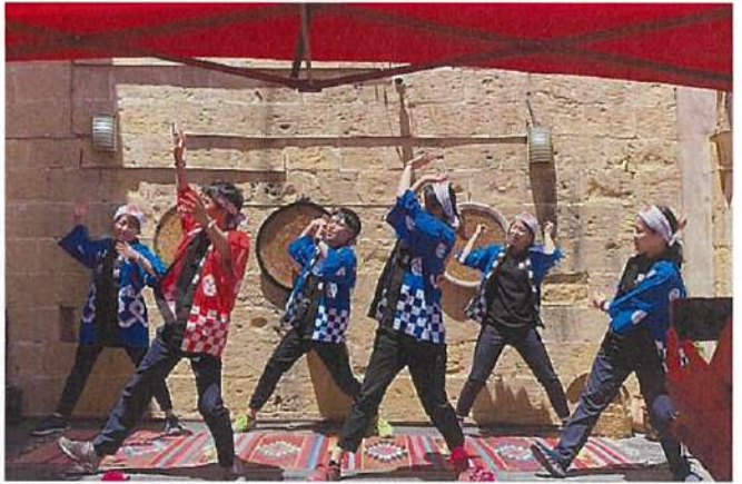
日本の踊りの紹介