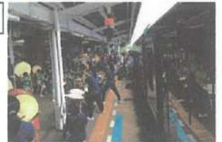
▲平成30年6月 運行開始1周年記念イベントの様子 ※今回の和太鼓演奏はホーム上ではなく駅前で行います。